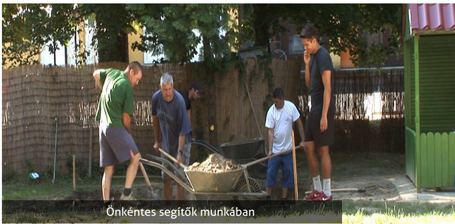
Önkéntes segítők munkában

Így aztán a Mókuskert óvoda udvarán 2 babaház megszüntetésével új árnyékolóval ellátott homokozó, valamint új futball- és kosárlabda pálya kerül kialakításra. Továbbá egy 8x10 méteres alapon nyugvó, biztonságos szabvány paraméterekkel rendelkező több funkcióú mászó-játékvár