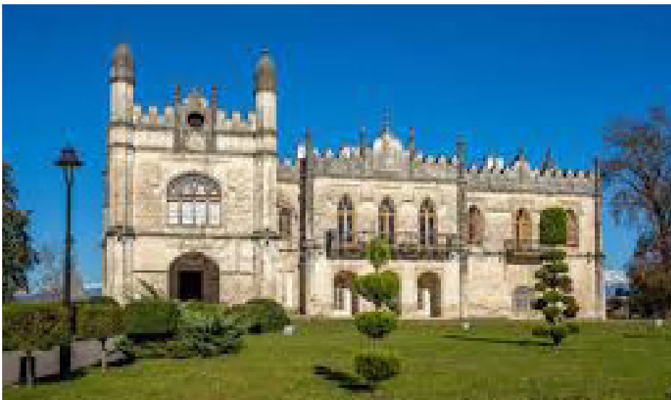
A Napoleon ereklyéket őrző Dadiani kastély

A család nevét a somogy megyei Zicsről eredeztető híres magyar festő és rajzművész Zichy Mihálynak még bizonyára akár több hétig is eltartott, amíg a grúz fővárosba, Tbiliszibe elért, de a mai utazó hamarabb ér el Budapestről Grúziába, mint Csurgóról Budapestre.