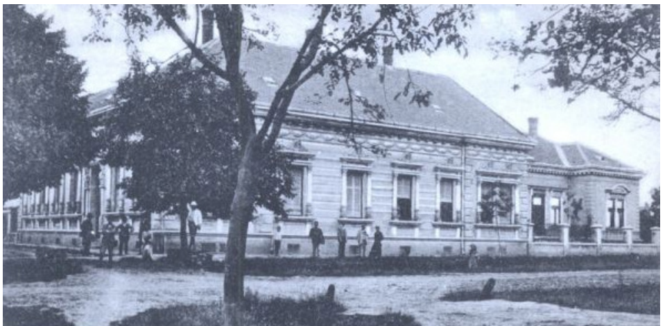
A Traubermann ház egy 100 éves képeslapon

Az egykori főbejárat két oldalán fejükön sisakot, nyakukban vasláncot viselő férfi fejek tartják az az ajtó feletti timpanont,