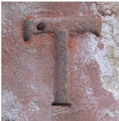
A Traubermann gyár pecsétés téglája

A Traubermann család csurgói létéről az 1800-as évek elejéről vannak adatok.