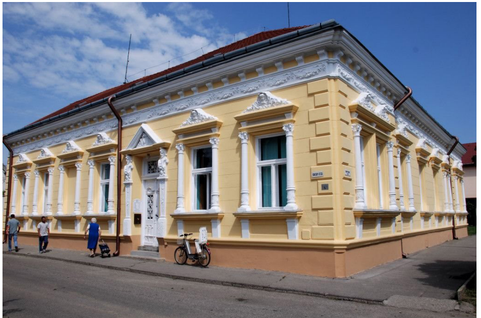
A Csurgó Városi Könyvtár épülete