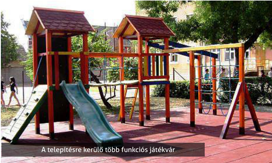
A telepítésre kerülő több funkcióú játékvár

Alig csendesedett el a gyermekszivajtól hangos Mókuskert óvoda környéke, máris még hangosabb munkagépek, csákányok, ásók és lapátok hangjától lett hangos az óvoda udvara. Az elmúlt évtizedek legnagyobb udvar átalakítási és megújulási folyamatai indultak el az idén 125 éves