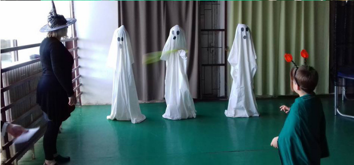
Újra megnyitotta kapuit a II. Rákóczi Ferenc Általános Iskola