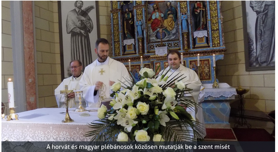
A horvát és magyar plébánosok közösen mutatják be a szent misét

A szent mise után a szomszédos kultúrotthon szépen megterített asztalainál