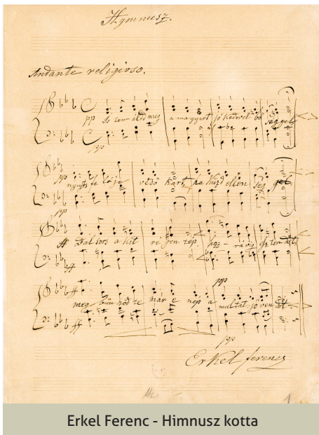
Erkel Ferenc - Himnusz kotta

Kölcsey Ferenc 1823. január 22-re elkészítve írta meg a „Hymnus”-t. Azt a versét, amely egymagában örökre megőrizte volna nevét, ha semmi mást nem is írt volna. Irodalomtörténészek kimutatták, hogy a költemény valószínűleg nem egyetlen napon született. Egyes gondolatok, kifejezések föllelhetők Kölcsey korábbi műveiben, más gondolatok pedig a még korábbi