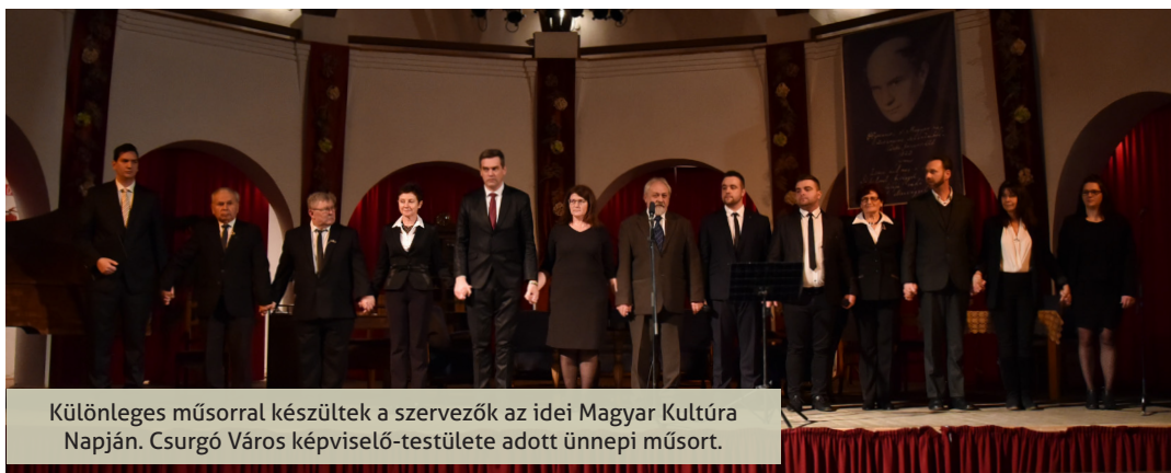
Különleges műsorral készültek a szervezők az idei Magyar Kultúra Napján. Csurgó Város képviselő-testülete adott ünnepi műsort.

Horvát partnerével közösen ünnepelte a Magyar Kultúra Napját Csurgó városa. A határon átnyúló horvát-magyar rendezvényre 2019. január 22-én Csurgón, a Csokonai Közösségi Ház nagytermében került sor. A Csurgó Város Önkormányzata és a Csokonai