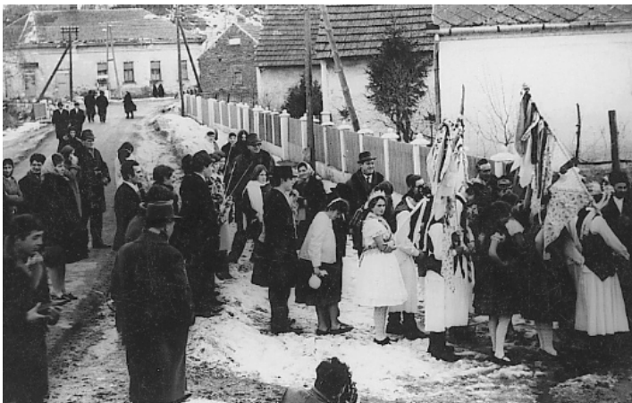
Lakodalmi menet a berzencei zászlós lakodalomban