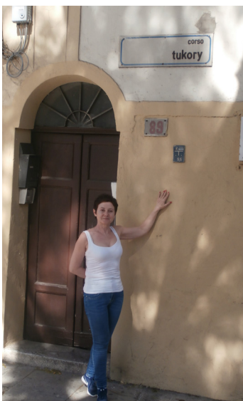
Magyar büszkeséggel a Tüköry Lajosról elnevezett utca névtáblája alatt

Amikor Tüköryhöz eljutott a hír, hogy Észak-Itáliában Giuseppe Garibaldi vezetésével függetlenségi harc kezdődött, kilépett a törököktől és olasz földön csatlakozott a többségében a 48-as