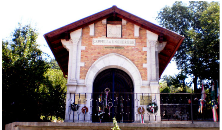
A Magyar Kápolna "Capella Ungherese" Visintiben

Doberdó neve egyetlen magyar ember előtt sem ismeretlen. Az első világháború idején magyar katonák ezreinek vére öntözött ezt az olasz-szlovén határ közeli kies, köves tájat.