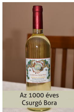
Az 1000 Éves Csurgó Bora

nalas rendezvényt sikerült megszervezni, melynek a visszhangja nagyon pozitív. Horvátországból, valamint a hegyközségtől is na-