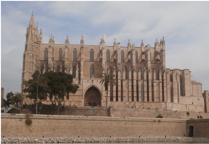
A Palma de Mallorcai Szűz Mária Székesegyház oldalképe