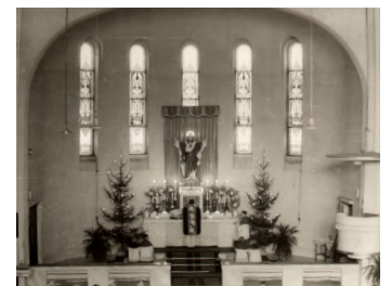
R.k. templom a Petőfi téren oltár részlet az 1960-as években