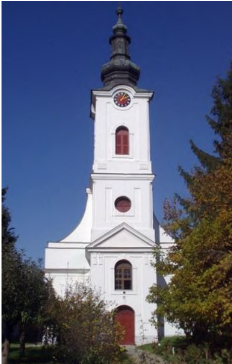
Az Alsoki Református Templom

„Az alsokiai új harangjai. A világháború folyamán, mint tudvalévő, a legtöbb helyen elrekvirálták az új harangokat, s ágyut, löszereket készítettek belőlük. Így történt ez a községünkkel szomszédos Alsokban is. Négy harangja volt az alsoki reformátusoknak, s a négy közül hármat be kellett szolgáltatniuk. A világháború befejezése után az alsoki református egyház gyűjtést indított, hogy ekkép hozza össze a szük-