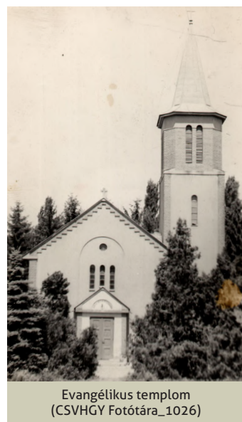
Evangélikus templom

ben adta át az evangélikus tanító házának szánt területet. A templomot akkoriban még a mai buszpályaudvar területére tervezték. Istentiszteleteket