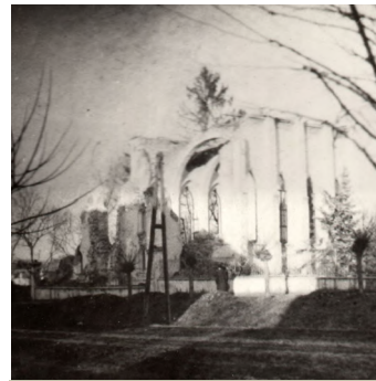
Református templom romjai

tek el a berendezési tárgyak is. Az ország legnagyobb barokk orgonáját a soproni evangélikus gyülekezettől vásárolták, sajnos, a több mint százéves