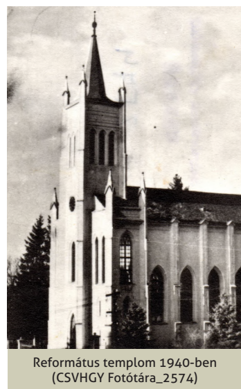
Református templom 1940-ben (CSVHGY Fotótára_2574)

méter magas templom hét évig épült. Verbay István református lelképásztor 1862-ben kezdte meg az építkezést adományokból, ő maga európai gyűjtőkör-