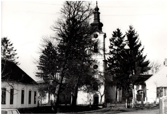
Ifjúság út, mai Sarkady tér, alsóki ref. templom

1779-ben Somogy vármegye által kirendelt bizottság vizsgálta, alkalmas-e az alsóki református oratórium befogadni a szomszéd községek híveit