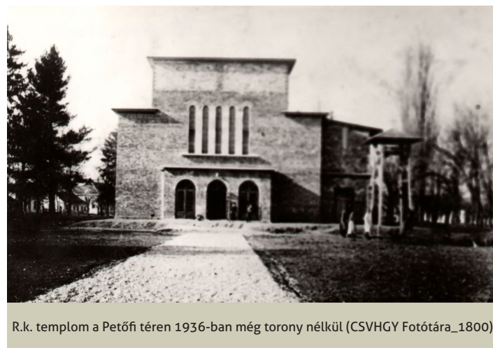
R.k. templom a Petőfi téren 1936-ban még torony nélkül

koriban épült sekrestyét is felhasználta hozzá. Az 1800-as évek végén rossz állapota miatt a frissen kinevezett Szijártó Károly plébános saját pénzén és adományokból felújította. A torony tetején levő keresztnek még az 1950-es években is látható volt a lovagrendi jelenlétre utaló fémszászló.