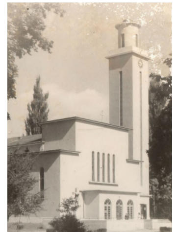
R.k. templom a Petőfi téren az 1950-es években