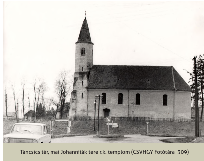
Táncsics tér, mai Johanniták tere r.k. templom

templomot rossz állapota miatt 1731-ben újjá kellett építeni, s nem csak a középkori tornyot, de valószínűleg a szintén ak-