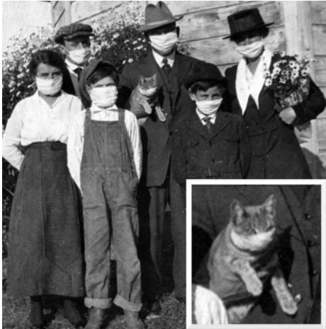
Spanyolnátha elleni védekezés 1918-ban

Pandémia. Karantén. Szájmaszk. Koronavírus. Új szavak mindennapjainkban. A hirtelen ránk törő járványos veszedelem átformálta az életünket, új és új kihívásokat állítva a mai kor emberei elé.