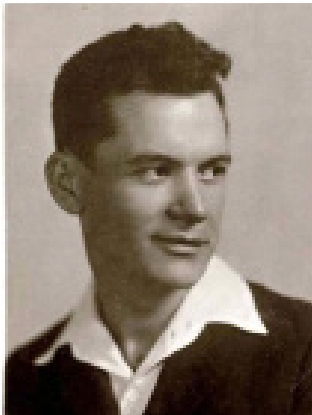
József Attila (1905-1937) egyik ritkaságnak számító, vidám arcképe

Rendhagyó versnépszerűsítő, megemlékező programot hirdettek meg a Csokonai Községi Ház munkatársai a Költészet napja alkalmából.