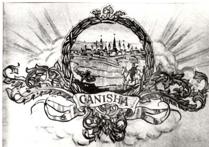
Nagykanizsa címerterve Fekete László tervei alapján (CSVHGY Fotóleltára_ILTSZ_1536)

na szentélyfreskóját szintén ő festette meg 1929-ben és 1938-ban a Hunyadi utca 7. szám alatt lakott. A Zalai Művészek Kislexikona is közöl róla