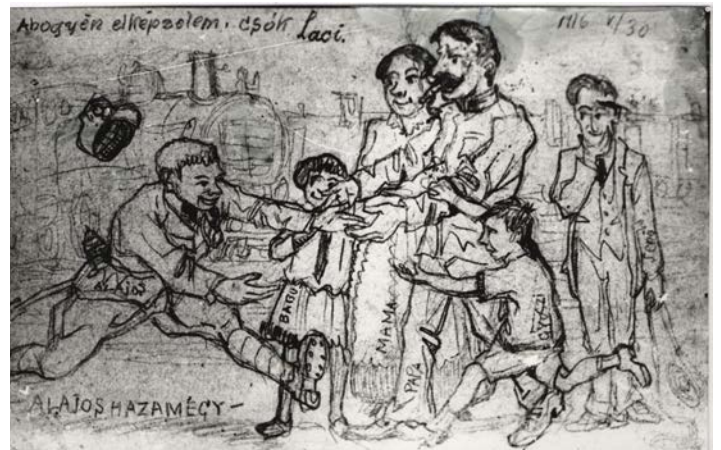
A Lajos hazamegy. Fekete László levelezőlapja 1916-ból (CSVHGY Fotóleltára_ILTSZ_1525)

lambok római katolikus templomában a falfestményt az 1920-as évek elején. Ekkoriban festett olajfestménye, amelyet valószínűsíthetően csurgói diákévei ihlettek, elveszett, csak