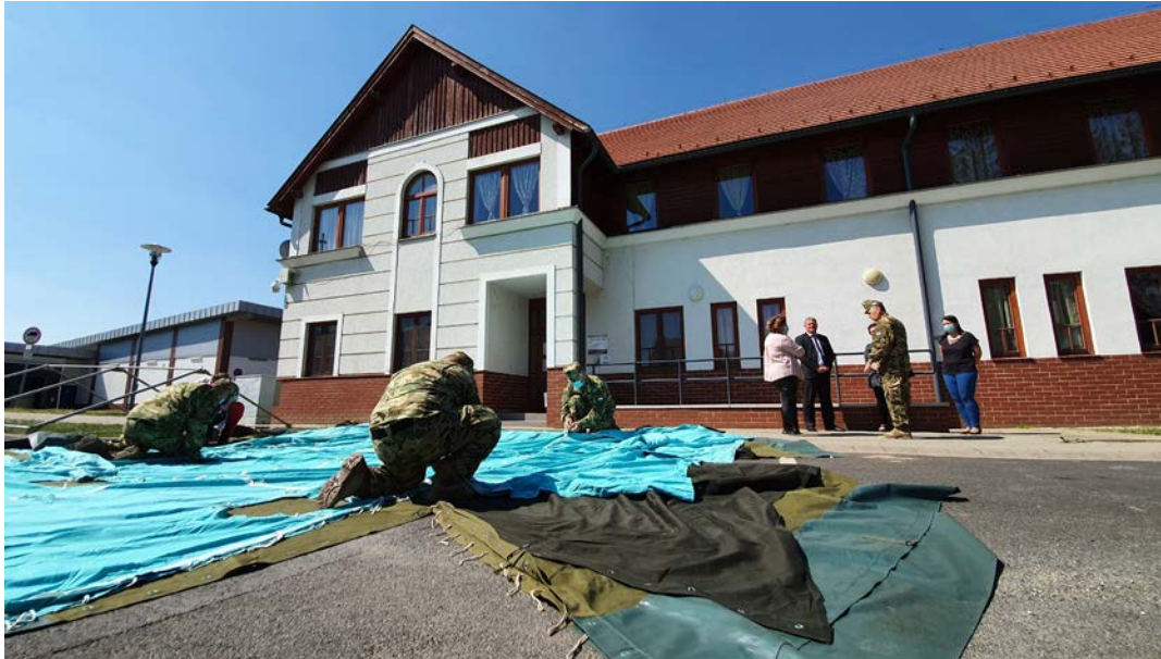
A Megyei Védelmi Bizottság a honvédség bevonásával biztosított előszűrő sátrat

Koronavírus előszűrő sátrat állítottak fel április 24-én a Csurgó Kistérségi Járóbeteg-szakellátó Központ sürgősségi ügyeletének bejáratánál. A Megyei Védelmi Bizottság bevonásával létrejött előszűrési pont egyelőre az ügyeletre érkezőket érinti. Az intézmény tájékoztatásában kiemelte: Csengetést követően, az ügyeletre érkező összes beteget kérdőív alapján kikérdezik, és hőmérséklet ellenőrzés történik. Az épületbe a csak nem koronavírus gyanús betegeket engedik tovább. A néhány perces igénybe vevő intézkedés mindannyiunk érdekét szolgálja.