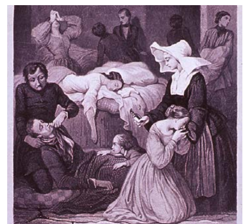
Kolerás betegek ápolása a múlt században