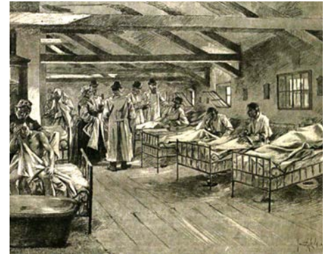
Kolerakórház Budapesten 1892-ben