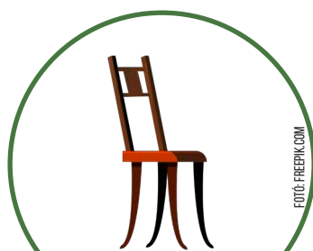
maga a háttámlás szék