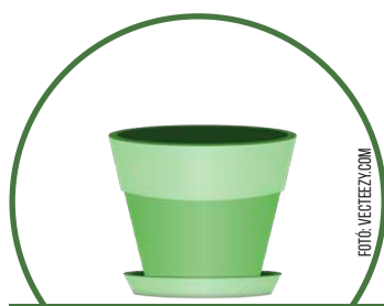
műanyag virág kaspó alsó tálcával