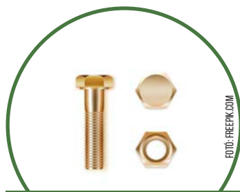
1 db csavar, anyával