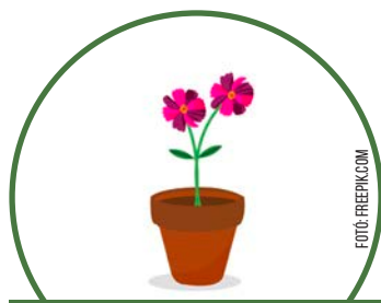
bármilyen cserepes virág, vagy balkonnövény