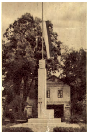
Az országzászló az átadás éveiben

Olvashatjuk Was Albert Intelem című versének sorait a csurgói Országzászló emlékmű legújabb emléktábláján, majd az idézet alatt kibővítve a következő sorokkal: