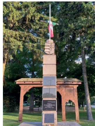
Az emlékmű napjainkban, a 100 éves trianoni évfordulón

A trianoni emléktábla helyének választása nem véletlen, hiszen az országzászlók építését szorgalmazó mozgalom elindítója a mélyesges trianoni