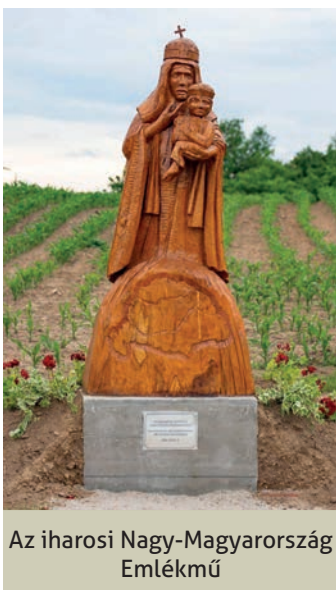
Az iharosi Nagy-Magyarország Emlékmű

2020. június 4-én, a trianoni döntés 100. évfordulóján került sor az iharosi Nagy – Magyarország emlékmű ünnepélyes felavatására. A falu felső