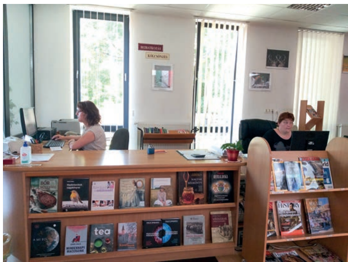
Munkában a könyvtár dolgozói

Az újság, így lapunk a Csurgó és Környéke is, olyan időszakonként megjelenő nyomtatott kiadvány, mely a média, a hírközlés eszközeiként folyamatos rendszerességgel híreket, információkat juttat el olvasó közönségéhez.