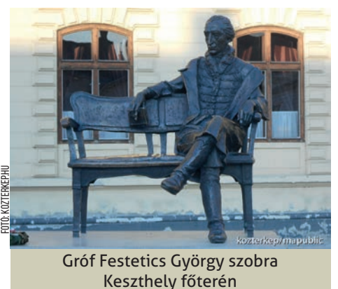
Gróf Festetics György szobra Keszthely főterén

— Ugyan már miért lőnék, - mondta az épp felérkezett gróf. Talán a miért a kötelességét pontosan teljesíti? Csak minden ember olyan volna. Ez még a személyben sem válogat! Hanem hát mást mondok én a tekintetes úrnak. Ha tudja, hogy ilyen természetű kutyája van, tetessen az ólja mellé egy ócska matraczot, hogy valami puhábbon fekhessék az ember!”