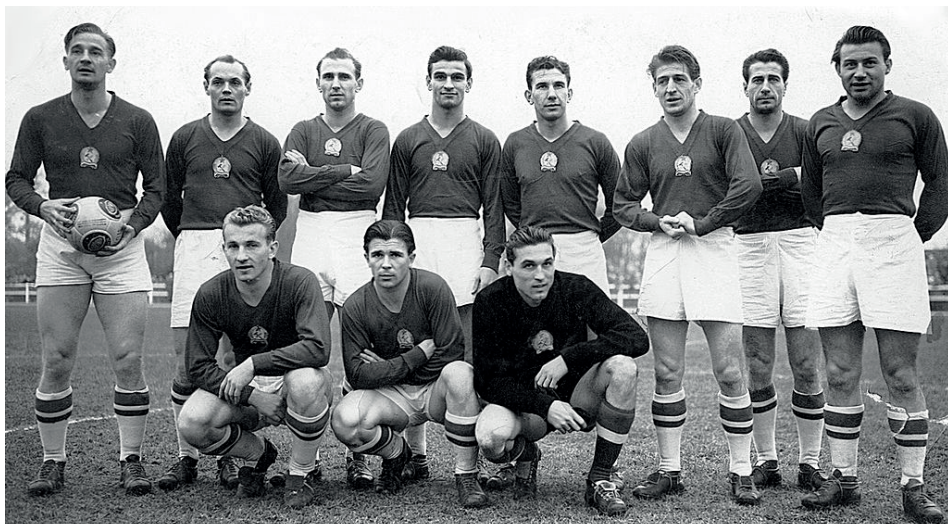
Az Aranycsapat 1953-ban

első sor: Lantos Mihály, Puskás Ferenc, Grosics Gyula hátsó sor: Lóránt Gyula, Buzánszky Jenő, Hidegkuti Nándor, Kocsis Sándor, Zakariás József, Czibor Zoltán, Bozsik József, Budai II. László