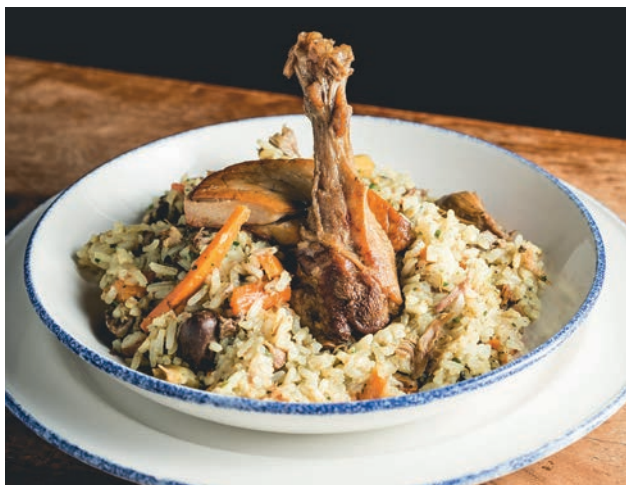
Márton napi ludaskása

Tartja az egyik legismertebb, a november 11-i Márton naphoz kapcsolódó szólás. „Ha Márton fehér lovon jön, enyhe tél, ha barnán, kemény tél várható.” Így szól a következő jósló mondás az időjárásról, azaz ha Márton napon fehér dér van, akkor enyhe tél lesz, de ha fagy nélküli barna föld, akkor kemény tél várható. Másik megfogalmazás szerint, ha: „Márton napján, ha a lúd jégen jár, akkor karácsonykor vízben poroszkál.”