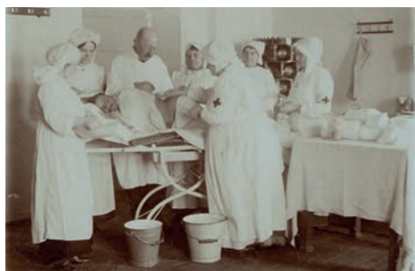
Műtéti beavatkozás a Csurgói kiegészítő kórházban az I. világháború idején