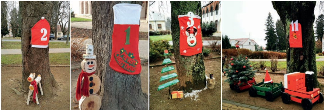
Minden nap újabb meglepetésekkel örvendezteti meg az érdeklődőket Csurgó köztéri adventi naptára

Igazi, karácsonyi hangulattal találkozhattak az idei ünnepi időszakban a Széchenyi téren sétálók. A sugárúti gesztenyesor ebben az évben már számos alkalommal mutatta új arcát, köszönhetően a Sportcsarnok Kft. kreatív munkatársainak. Egyedi hangulatával és megjelenésével sokak számára okozott a nyár folyamán boldog pillanatot a horgolt terítőbe öltöztetett fasor, ősszel számtalanszor vált gyerekszivajtól hangossá a több mint 200 faragott tökkel feldíszített park. Épült továbbá egy lakatfal a Szerelmesek Fája köré, és kihelyeztek egy kupakgyűjtő szívet is. A karácsony közeledtével pedig adventi naptárrá változtak a sugárúti fák. Az ötletgazda Márton-Szűcs Brigitta szerint a koronavírus idején különös jelentőséggel bír mindez, hiszen akciójuk közösségről, munkáról, önzetlenségről és egymás iránti odafigyelésről is árulkodik.