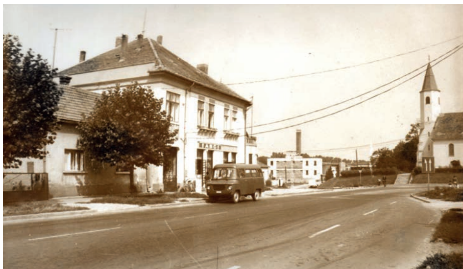
A Tejüzem egy távlati képen az 1960-as évekből

Sokan emlegetik még ma is, nem csak Csurgó, de Somogy vagy akár ország szerte is a Csurgón készített trappista sajt semmihez nem hasonlítható, finom ízét.