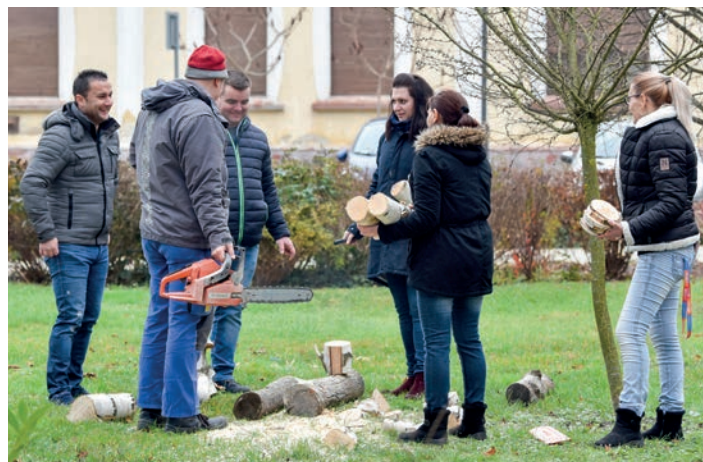
Vidám hangulatban, újabb meglepetés készül

Az adventi időszakban fontosnak gondoltam, hogy hasonlóan a korábbi tökös akciókhoz, a karácsonyi időszakban is örömet okozunk az embereknek. Az ötlet onnan jött, hogy otthon a kislányomnak is készítek adventi naptárat, és minden nap érkezik az anyuka hozzá, és valami kis aprósággal meglepi. Egyik nap mikor elvittem az óvodába, és sétáltam visszafele a munkahely felé, ahogy jöttem a sugárúton elkezdtem számolni a fákat, több mint 24 darab fát számoltam, és meg is született az elképzelés. Elkezdtem rajta gondolkodni, hogy hogyan lehetne úgy feldíszíteni a su-