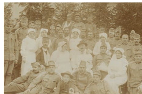
Csurgói kiségitő kórház csoportképe az I. világháború idején