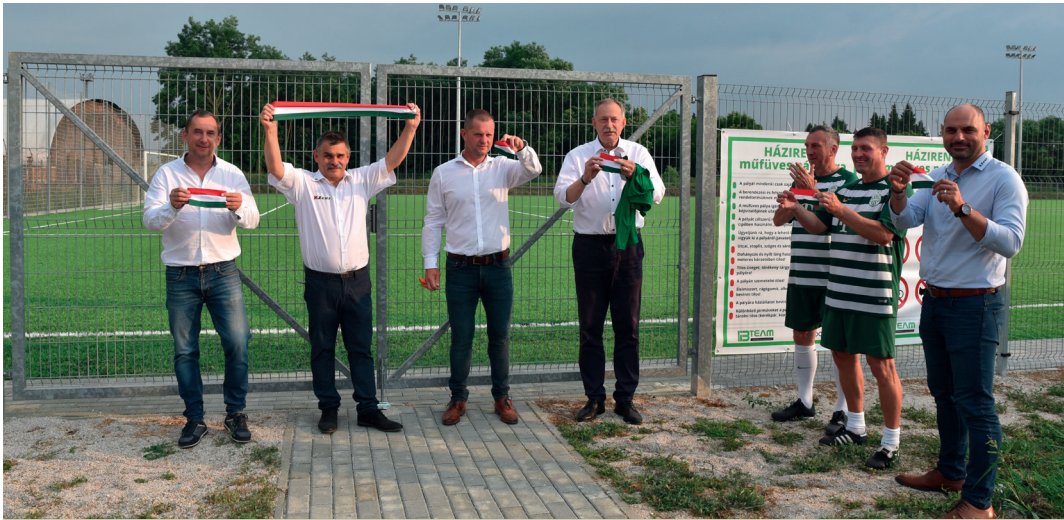
Modern körülmények között kaphat új lendületet a Csurgói Torna Klub

Nagyméretű műfüves pálya (68 m x 105 m) átadására került sor Csurgón, 2021. július 18-án. Az ünnepélyes keretek között történt eseményen a Ferencvárosi Öregfiúk gála-mérföldközzel emelték és tisztelték meg a 100 éves Csurgói egyesület jubileumát.