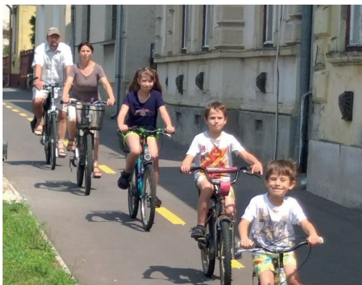
A szabályos, környezettudatos közlekedés megismertetését már gyermek korban el kell kezdeni. Kétkeréken a Pápa család.

A mozgást, sportot kedvelő, környezettudatos ember számára különösen öröm, hogy útjainkon egyre több kerékpárost lehet látni, akik folyamatosan fedezik fel, hogy bringákkal gyorsan, könnyen, olcsón és az autóknál nagyobb szabadsággal közlekedhetnek a mindennapokban, vagy kapcsolódhatnak ki a szabadidejükben. A kerékpározók számának növekedésével azonban méginkább szükséges figyelni a kerékpározás közlekedési szabályainak betartására.