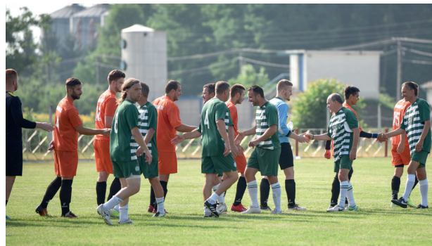
Csapatok találkozása: Csurgói Torna Klub, Ferencvárosi Öregfiúk

A kezdeményezésnek köszönhetően sorra alakultak a Turul Egyesületek. Az 1922-es évben 20 egyesület működött