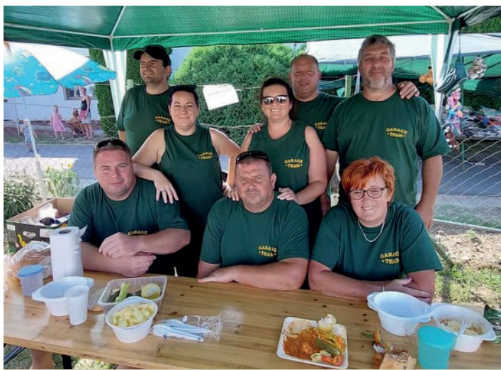
I. helyezést ért el a "Szeretem Nagybakónakot Fesztivál" pörköltfőző versenyén a Garage Team

Nagybakónak zsáktelepülés Nagykanizsától északra, dombok között egy völgyben fekszik.