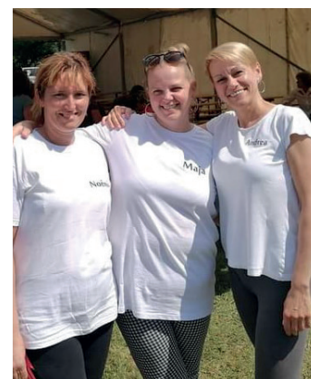
A Konyhai Ördögei

versenyre mellyel a második helyezést sikerült elérniük. A zsűri kiemelte a nagyon szép tálalást és az exkluzív asztal díszítést.