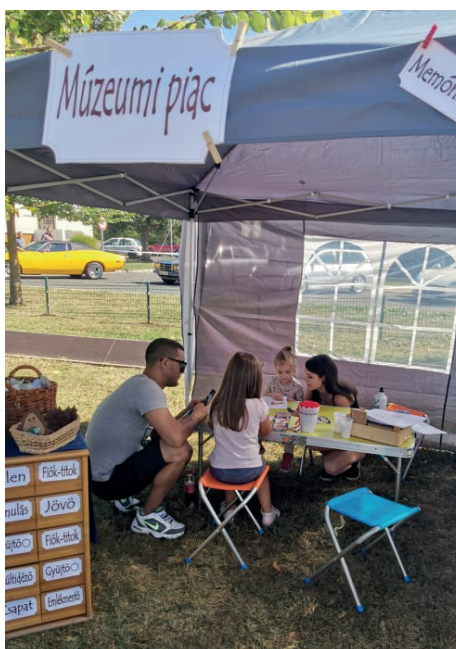
Őszi Napok 1

Hasonló koncepcióra épült a múzeumi fűszeres szekrény: a fiókok kihúzásával képet kaphattak a látogatók a Helytörténeti