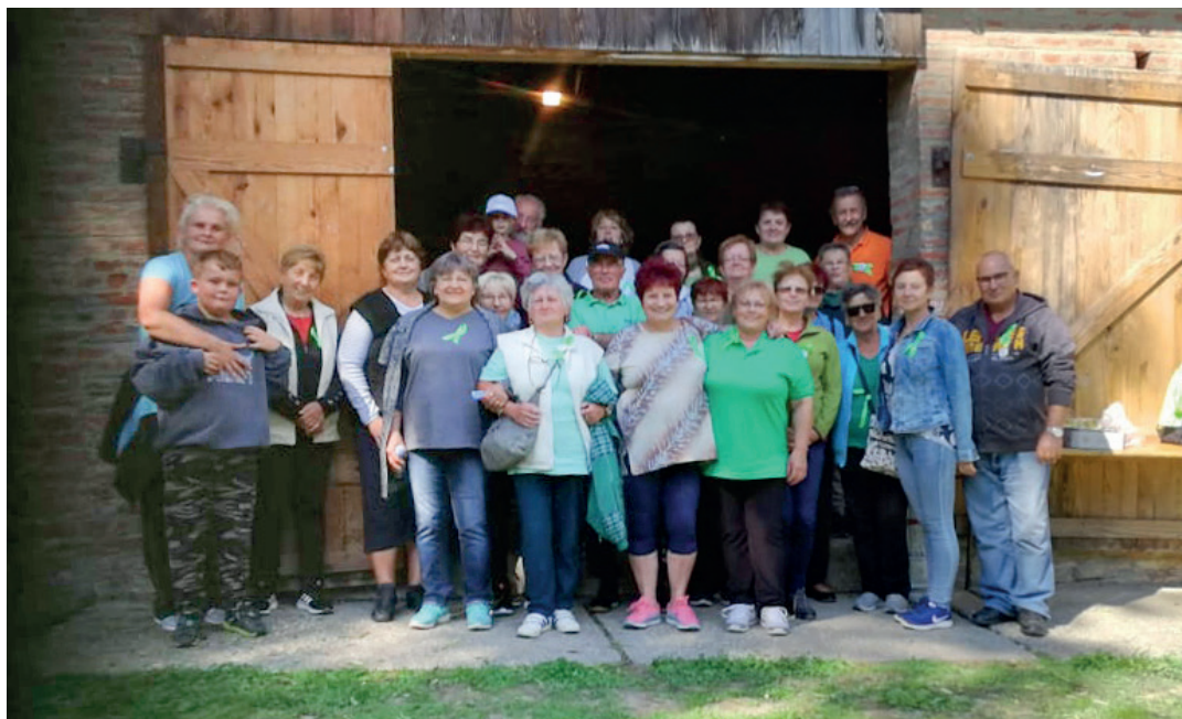
A Rákellenes Liga tagjainak nagymartoni csoportképe

Szeptember 15-e a limfóma elleni küzdelem világnapja. A limfóma, a nyirokrendszer olyan rosszindulatú daganata, amelyben a nyirokrendszer fehérvérsejtjei (limfociták) daganatos sejtekként kezdenek el viselkedni, kontroll nélkül növekednek, osztódnak. Ezek a kóros limfociták leggyakrabban a nyirokcsomókban gyűlnek össze, duzzanatot és szövetváltozást okozva. Egyéb esetekben leginkább a lépben, a májban, a csontvelőben, a gyomorban fordulhatnak elő.