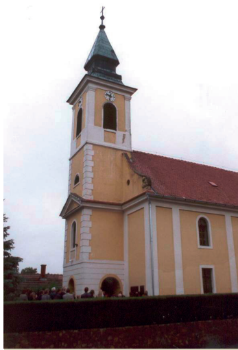
A történelmi eseményeknek helyet adó iharosberényi evangélikus templom.