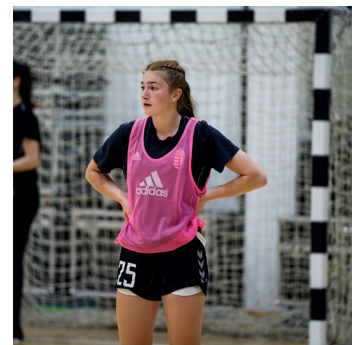
démia NBI/B-s felnőtt csapatának a játékosa.

A két kiváló sportoló jelenleg a Nemzeti Kézilabda Aka-