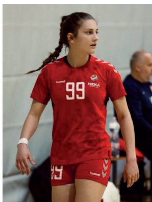
A Magyar Kézilabda Szövetség közleményében nyilván-

nosságra hozta az EHF 2021-es utánpótlás-ranglistáját. Ez alapján Magyarország – holtversenyben a németekkel – az élen áll az idei három korosztályos világversenyen elért eredmények alapján. Ezen nem is kell csodálkozni, hiszen júliusban az U19-es leány Eb-n Celjében, augusztusban pedig az U17-es lányok kontinensversenyén Montenegroban is hatalmas fölényrel nyertek a mieink. Lényegében nem volt olyan mérkőzés, amelyen iga-