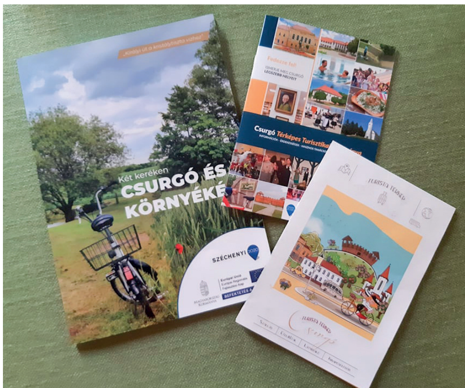
Hívogatóan tetszetősek az új kiadványok

vü példányokat is beszámítva 1500, Csurgó turisztikai térképes kiadványt 2000 példányban nyomtattattuk a Szülőföld Könyvkiadó Kft. megbízásával.