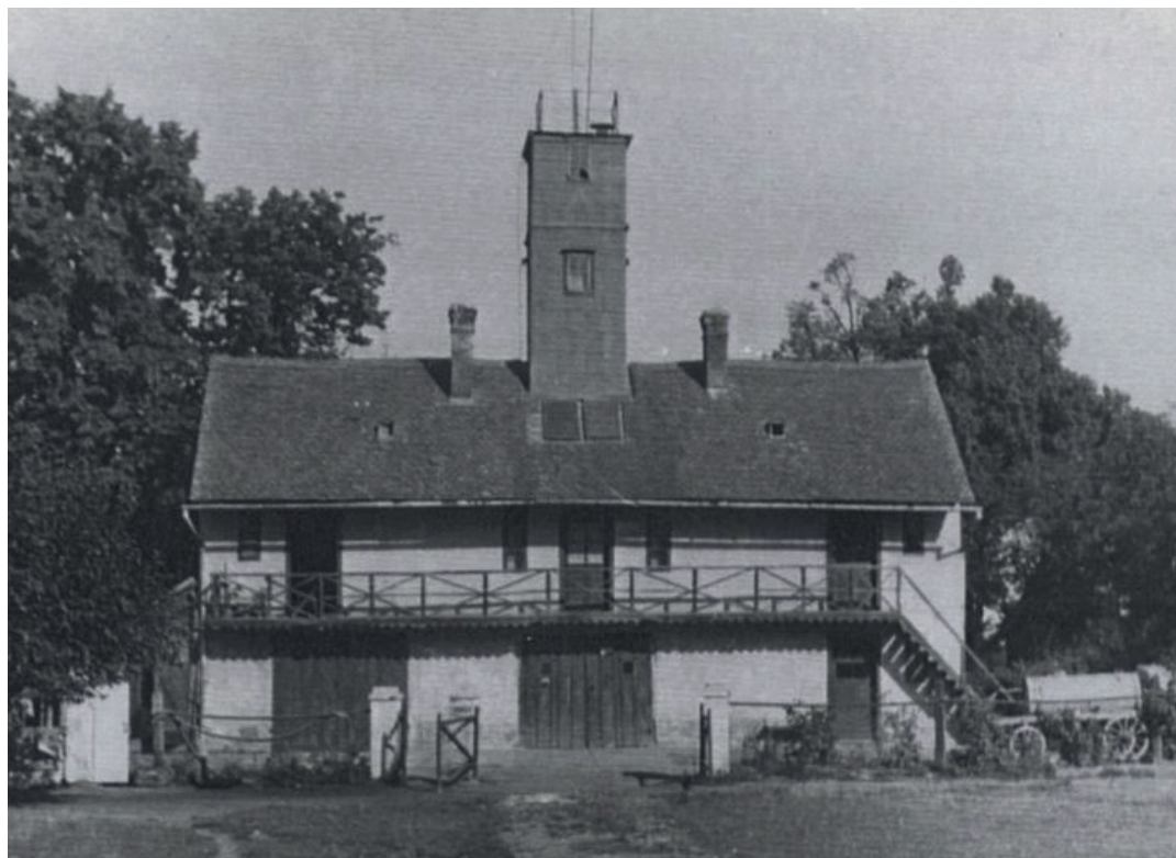
Az 1874-ben alakult tűzoltóság szertára a Petőfi téren