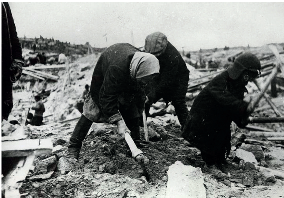
Nem csak férfiakat, hanem nagy számban nőket és gyermekeket is dolgoztattak a munkatáborokban

Gulág. Sokak családi emlékezetében máig is rossz emlékeket idéz ez az öt betűs szó, melynek jelentése alatt a sztálini Szovjetunió egészét behálózó munkatáborrendszert értjük, ahol a fennálló politikai rendszer ellenzőit, hadifoglyokat, civileket tartották fogva és köteleztek fizikai munkavégzésre.