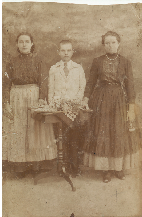
Ismeretlen elődök. Vajon kik az utódok?

Két közeli volt és leendő ünnepünk, a Halottak napja és Karácsony táján erősödnek a családi kapcsolatok, bővülnek a találkozások. Szóba kerülnek élők és holtak. Neveket olvasunk a fejfákról, évszámokat jegyzetelünk. Meghallgatjuk az egyszer