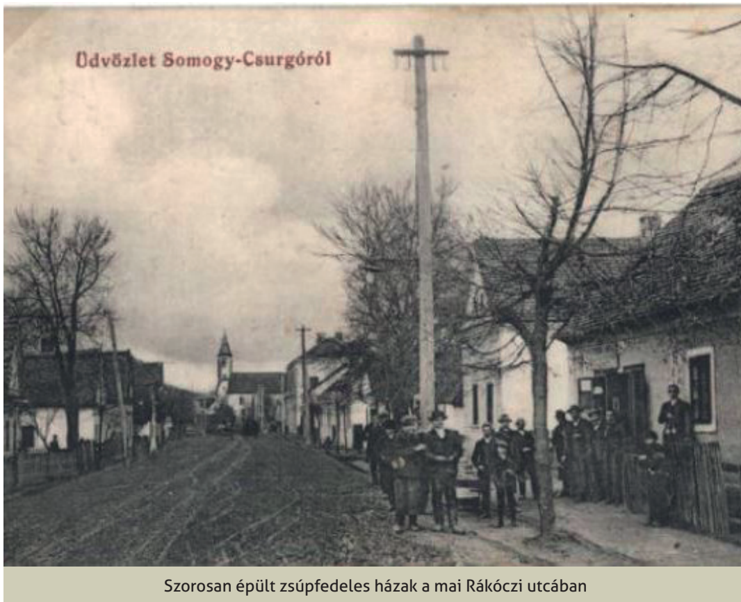
Szorosan épült zsúpfedeles házak a mai Rákóczi utcában

Napjaink korszerű tűzvédelmi és tűzoltási technikái mellett is számtalan tragikus tüzesettel találkozhatunk. Az ember egyik legjobb barátja, a vörös kakas számtalan előnye mellett sok veszélyt is rejt magában. A „Tűz van! Tűz van!” kiállítás minden időkből az egyik legféltettebb hangzó figyelemfelhívás volt.