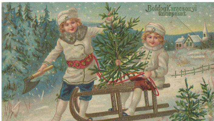
Fenyőfát szállító gyerekek. Képeslap az 1920-as évekből.

A római korban a téli napfordulók a fényesség éledését, az egyre hosszabbodó nappalokkal a fény újjá születését