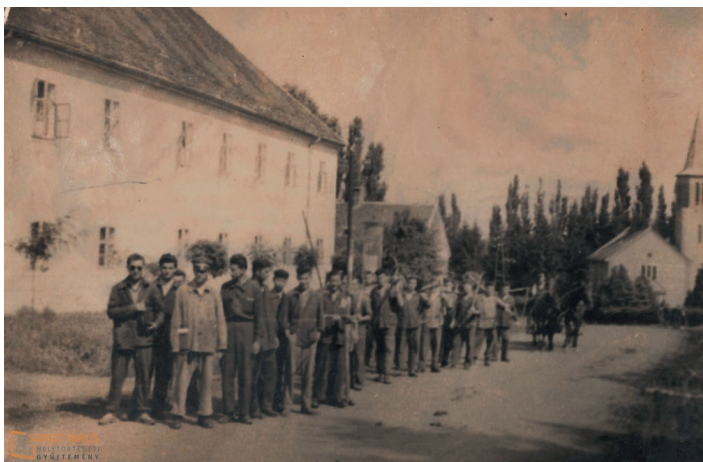
14. ablak A csurgói Mezőgazdasági Szakiskola diákjai az 1960-as években az iskola előtt

A tavalyi évvel indult útjára a Helytörténeti Gyűjtemény adventi kalendárium. Míg 2020-ban a múzeum ablakai voltak feldíszítve az éppen aktuális napi témával (tűzoltóság, vöröskereszt, iskolaélet, stb) és Facebookon voltak megosztva fényképek, addig idén a kalendárium a Széchenyi térre költözött. December elsején a Városgazdálkodási Kft. munkatársainak segítségével egy paravánt helyeztünk ki, amelyre