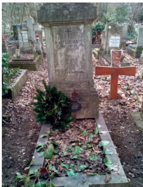
A Meller és Prokupek család sírköve

A Meller kastély mindenki előtt ismert Csurgó és térségében. A kastély látványán kívül azonban a család tagjairól egy 100 éves, homályos képeslapon kívül egyetlen fotó sem maradt fenn. A kitartó kutatás azonban néha nem várt helyekről is hozhat eredményeket, melyek révén megismerhetjük a Meller kastély utolsó lakójának arcát és végső nyughelyét is.