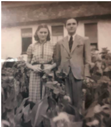
16 évesen, testvérével a Meller kastély parkjában

Gimnáziumi évei alatt, fiatal diákként értelmetlennek ítélte a latin nyelv tanulását, míg nem egy latin idézet, a "Non scholae, sed vitae discimus." azaz „Nem az iskolának, hanem az életnek tanulunk.” világosított meg előtte, hogy mások kiszolgálásától csak úgy menekülhet meg, ha tanul!