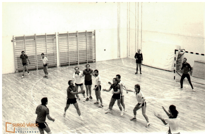
15. ablak Az I. sz. Általános Iskola tornatermének avatómérkőzése 1983-ban