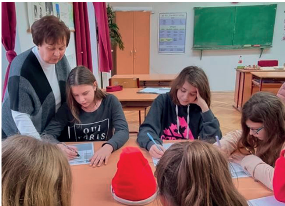
A Tanárnő tanítványai körében

tottá váljanak az anyanyelv ápolására. Tapasztalatom szerint lelkiekben kell közel kerülni hozzájuk, sok őszinte beszélgetéssel. El kell érni, hogy elfogadják a pedagógus személyiségét, ezáltal a tanítási-nevelési elveit.