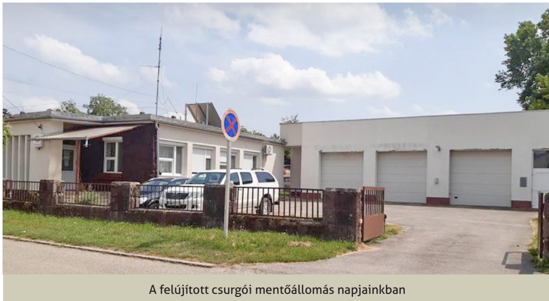
A felújított csurgói mentőállomás napjainkban

Több kisebb felújítás után, a 2016 januárjában átadott épületberuházásának eredményeként a mentőállomás teljes épülete, valamint a hozzá tartozó garázs rész is teljesen