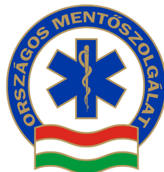
Az OMSZ címere

A folyamatos szakmai fejlődést rendszeres továbbképzésekkel, éves kötelező vizsgákkal biztosítja az Országos Mentőszolgálat dolgozói számára.