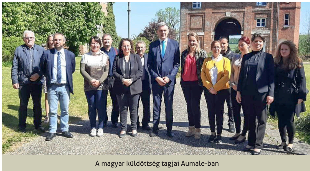
A magyar küldöttség tagjai Aumale-ban

A magyar közmédia csaHárom évvel ezelőtt, 2019-ben meghívást kapott a Csurgói Városi Szociális Intézmény a franciaországi Aumale-ba, a helyi idősellátás működésének megismerésére. Két év egészségügyi válság után, tovább folytatva az eszmecserét, valós igény jelentkezett mindkét fél részéről, hogy megértsék, hogyan működik egymás idős embereket ellátó szociális intézményi rendszere. A tanulmányúttal egyben lehetőség adódott arra is, hogy felidéződjenek és felfrissüljenek a kapcsolatok, amelyek már 1992 óta összekötik a két várost.