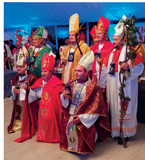
A frissen avatott borpüspökök

17 évvel ezelőtt, a megye 3 városának Kapronca (Koprivnica) Körös (Križevci) és Szentgyörgyvár (Đurđevac) borpüspökei a megye vezetőivel együttműködve kezdeményezték a térség borpüspökeinek összefogását, és a Márton naphoz kapcsolódó nagyrendezvény létrejöttét. Azóta a 3 település felváltva ad otthon november elején a borszenteléssel egybekötött programnak, melyet a koronavírus járvány miatt két év kihagyással rendezhettek meg újra idén. Mindig Márton naphoz közel, megegyezés szerint a Mindenszentek utáni első szombaton tartják. Az első alkalommal, 2005-ben Körösön rendezték meg, 10 helyi püspök jelenlétében, most már Dalmációból, Zágrábból, Krk szigetről, Szlavóniából, az ország több megyéjéből is érkeznek borpüspökök. Idén a kaproncai rendezvényen több mint 400 fő vett részt, 21 borász, körülbelül 15 borászati egyesület.