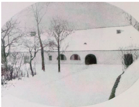
A tapsonyi régi megyeháza és börtön

zoltak látta, a tapsonyi börtönben raboskodó Hampu Erzsébetet lefejezésre és máglyán való elégetésre ítélte.