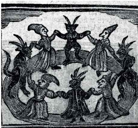
Ördögökkel táncoló boszorkányok ábrázolása az 1700-as évekből