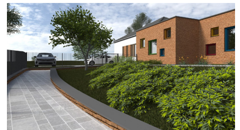
Látványterven az épülő két csoportos bölcsőde