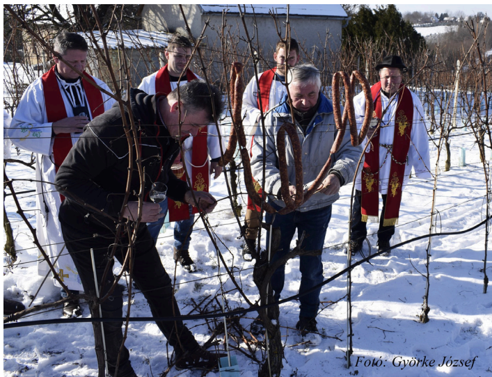
Szép szál kolbászok alatt zajlott a Vince napi vesszővágás

Bizony szépen csillogott a téli napsütésben a fehér hó a csurgói szőlőhegy lankáin, mikor is a Csurgói Borbarát Kör tagjai és a meghívásukra érkezett Gyurgyeváci Gyümölcs- és Szőlőtermesztők Egyesületének tagjai családjakkal kivonultak a szőlősorok közé, hogy felelevenítsék a január 22-i