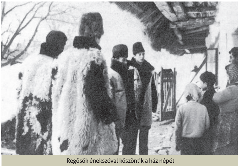
Regősök énekszóval köszöntik a ház népét

Az újév kezdetét jelző januári jeles napok és népszokások nagyrészt a kereszténység ünnepköreihez kapcsolódnak, azok emlékét őrzik. Azonban sok mindent hoztak magukkal még a pogány kori ünnepek soraiból is.