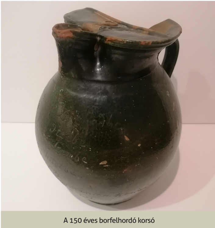
A 150 éves borfelhordó korsó

Az évfordulók, különösen egy születésnap mindig fontos esemény. Idén, pontosabban szeptember 20-án azonban nem egy személy, hanem kivételes módon egy műtárgy születésének 150. évfordulóját ünnepeljük a Helytörténeti Gyűjteményben.