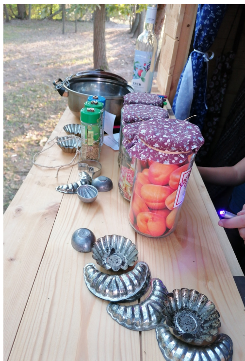
Zajlik a játék Berzencén

A Szabadulókonyhával először a júniusi Csuszafesztiválon találkozhattak az érdeklődők, az egyik bódé akkor szabadulósobává alakult át, aktualitása mi is