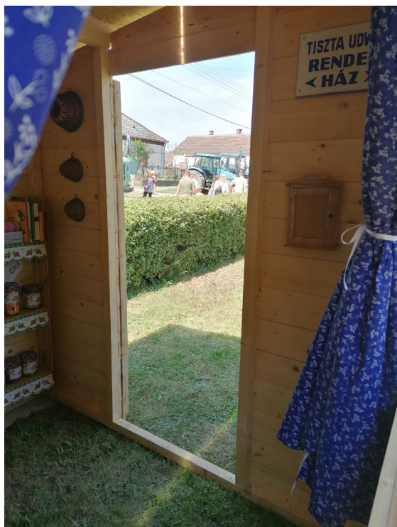
A porrogi V. Traktor Találkozózn