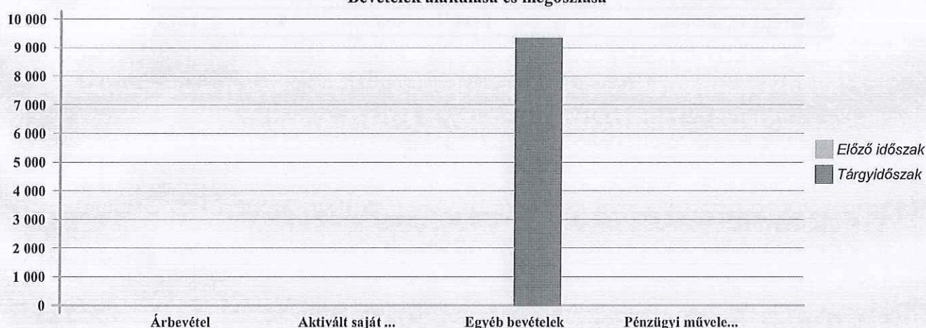
Bevételek alakulása és megoszlása