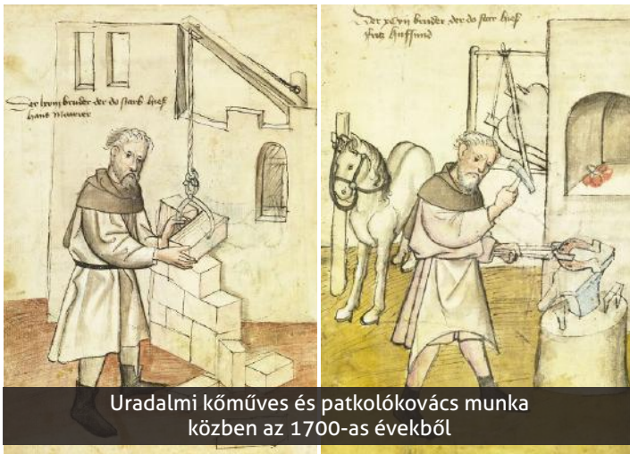
Uradalmi kőműves és patkolókovács munka közben az 1700-as évekből

Csurgó iparosságának első adatai a XVIII. századra vonatkoznak, a Festeticsek idejében a nagy földesúri majorépítkezések megindulásától. A csurgói uradalomban az árendás(vándorló) iparosok között az 1763-tól 1793-ig tartó időben kötött szerződések alapján megállapítható, hogy részben német, részben horvát, és csak kis részben magyar eredetű iparosok dolgoztak. Németek voltak Csurgón Stettner János szabó, Ulmann Mátyás és Cristian süvegesek, és C. Lanzendörfer abroncskádár azaz pintér 1722-ben. 1792-ben már állandó jelleggel dolgozott egy horvát nemzetiségű, Paulits nevű kőműves a szomszédos Berzencéről.