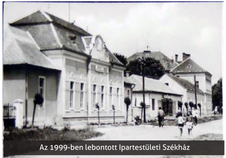
Az 1999-ben lebontott Ipartestületi Székház