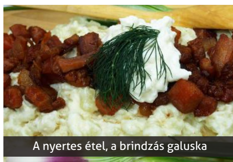
A nyertes étel, a brindzás galuska