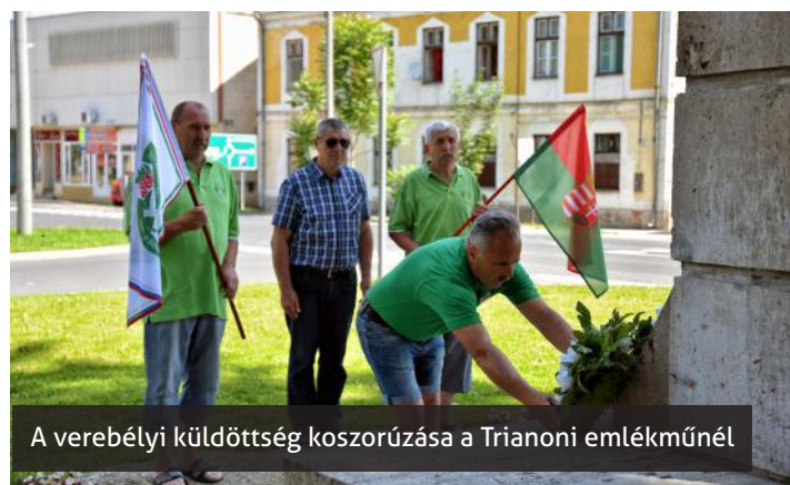
A verebéli küldöttség koszorúzása a Trianoni emlékműnél