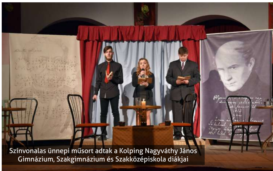
Színvonalas ünnepi műsort adtak a Kolping Nagyváthy János Gimnázium, Szakgimnázium és Szakközépiskola diákjai