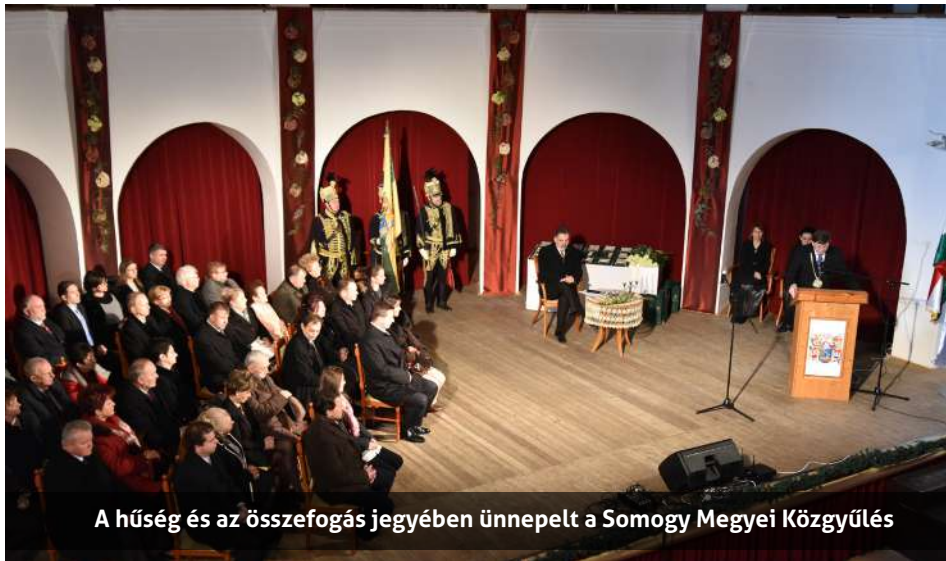
A hűség és az összefogás jegyében ünnepelt a Somogy Megyei Közgyűlés

Ünnepélyes bevonulással vette kezdetét Csurgón a megyecímer 519. évfordulójának tiszteletére rendezett megyenap. A hűség és az összefogás jegyében ünnepelt a Somogy Megyei Közgyűlés.