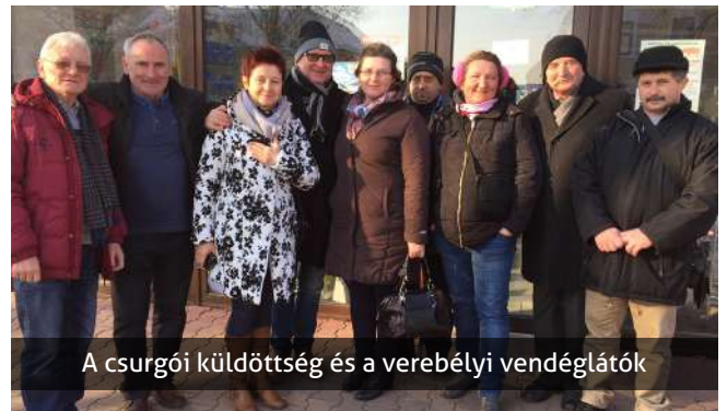
A csurgói küldöttség és a verebélyi vendéglátók

Természetesen vendéglátóink minket is bőszegesen végig kínáltak a számtalan jóízű finomságból, és a hozzájuk illő italokból. Az illatos barack és a keményebb törköly pálinkából, valamint a