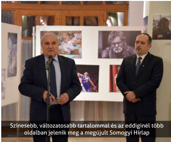
Színesebb, változatosabb tartalommal és az eddiginél több oldalban jelenik meg a megújult Somogyi Hírlap