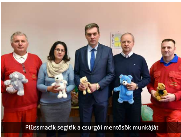
Plüssmacik segítik a csurgói mentősök munkáját