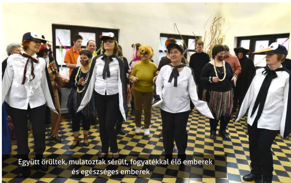
Együtt örültek, mulatoztak sérült, fogyatékkal élő emberek és egészséges emberek

Jelmezbe öltözve, vidáman mulatozva búcsúztatták a telet a Napsugár Szociális Intézmény ellátottjai. Közel százan gyűltek össze február 18-án a farsang jegyében, ahol a zenés-táncos felvonulás mellett a szendvics, süti vásárlás, valamint a tompo-