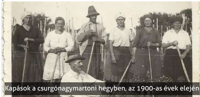
Kapások a csurgónagymartoni hegyben, az 1900-as évek elején

A szőlő munkaigényes műveléséhez azonban sok dolgozó kézre volt szükség. Ezért aztán a szomszédos Berzencéről egész családok és napszámos csapatok jöttek szekerekkel, sokszor több napra is jó pénzért dolgozni az alsoki gazdáknak. Abban az időben, a 18-19., de még a 20. század elején is álltak a pincék mögé épített nyitott, nyári istállók a lovak, ökrök számára. Hiszen a nagy, 4-5-6 kilométeres távolság miatt az alsoki, sarkadi, de még a csurgói családok maguk is kiköltöztek a hegybe, főként a gyorsan végzendő idénymunkák, kapálások és kötözések, de még szüret idejére is.