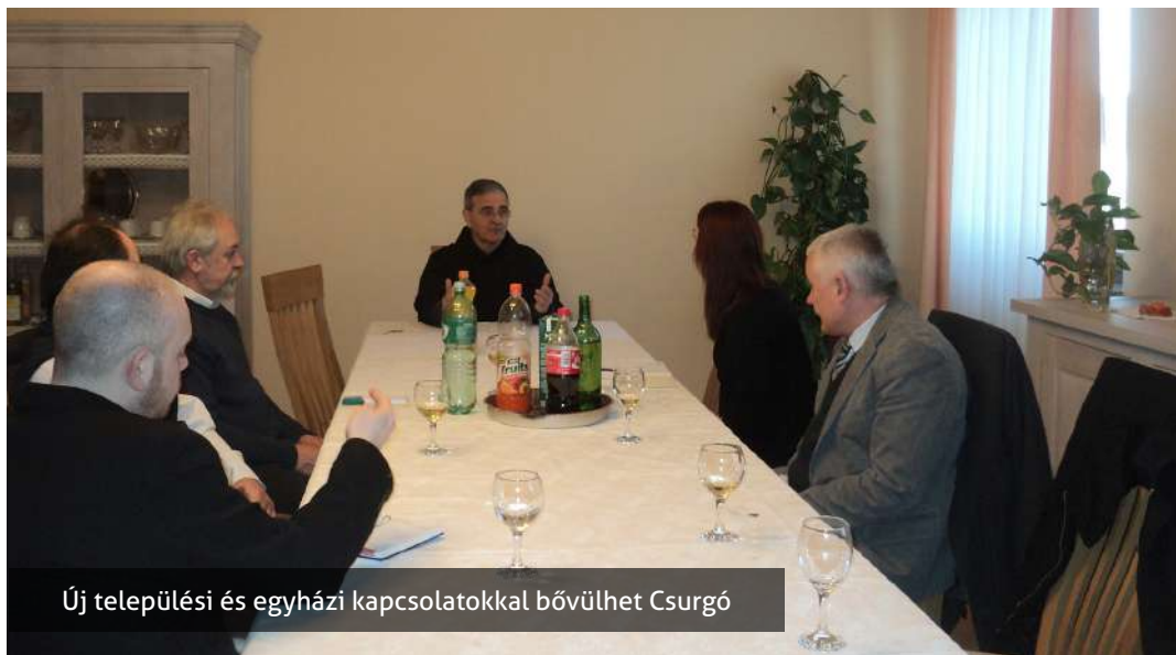
Új települési és egyházi kapcsolatokkal bővíthet Csurgó