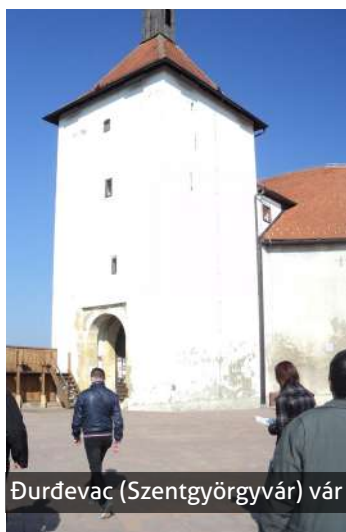
Đurđevac (Szentgyörgyvár) vár