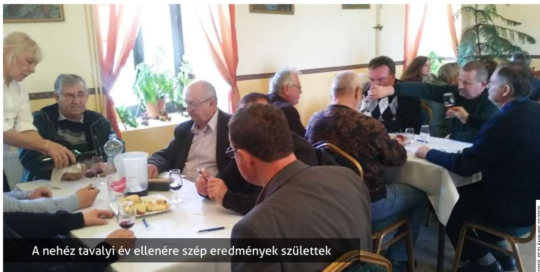
A nehéz tavalyi év ellenére szép eredmények születtek

Huszadik alkalommal rendeztek nemzetközi borversenyt Csurgón. A Csurgói Csokonai Borlovagrend február 25-i versenyére négy ország 21 településéről összesen 135 minta érkezett a 16 tagú zsűri elé. A szakavatott külföldi és magyar borbírók nemzetközi szabvány szerint, 20 pontos rendszerrel bíráltak, értékelve a beérkezett minták színét, tisztaságát, illatát és összbenyomását.