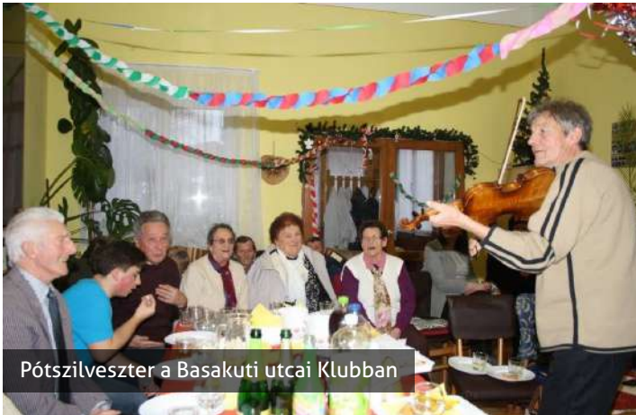
Pótszilveszter a Basakuti utcai Klubban

Az új év első hónapjaiban általában minden intézmény és szervezet elkészíti az adott év munkatervét, át gondolja éves teendőit.