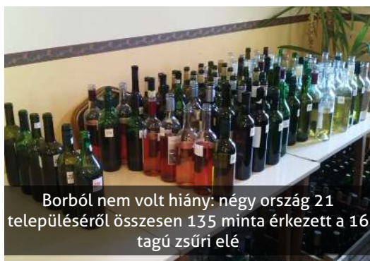
Borból nem volt hiány: négy ország 21 településéről összesen 135 minta érkezett a 16 tagú zsűri elé

Számos termelőhelyről érkeztek minták, így Erdélyből, Szlovákiából, az Istriáról, Gyurgyevácról, Székesfehérvár környékéről, Bolhóról, továbbá a Drávamelléke magyar oldaláról és természetesen a helyi borok is részt vettek a megmérettetésen.