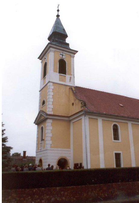
Iharosberény - templom