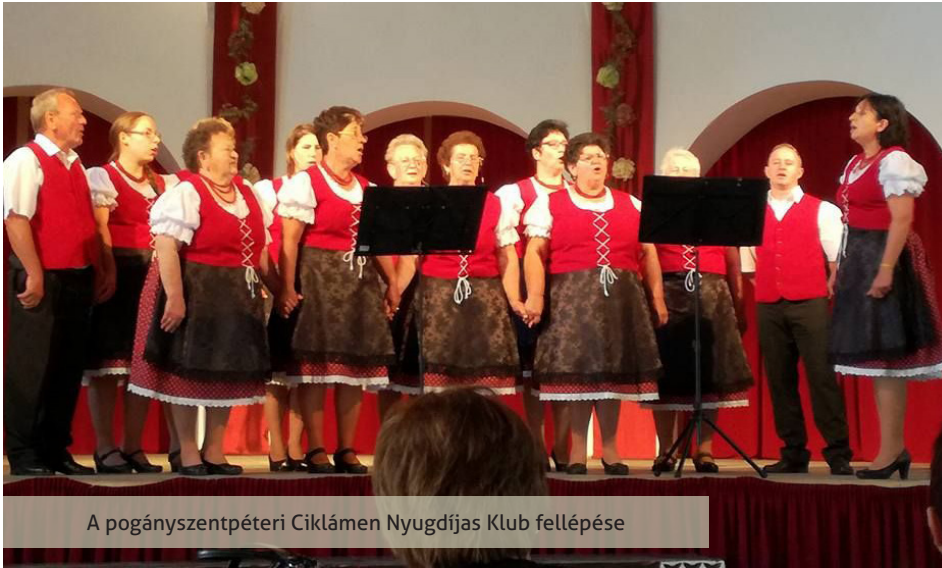
A pogányszentpéteri Ciklámen Nyugdíjas Klub fellépése

Szín pompás népviseletekbe és egységes fellépő ruhákba öltözött csoportok töltötték meg a Csokonai Községi Ház előterét május 20-án, ugyanis a Dráva-menti Nyugdíjas Egyesület és a Nyugdíjasok Szervezeteinek Somogy Megyei Szövetségének szervezésében ekkor került megrendezésre a Dráva-menti Kistérség Tavaszi Fesztiválja. Az eseménynek nem kisebb tétje volt, mint az októberi Megyei Művészeti Gálákra fellépő résztvevők és csoportok előzetes kiválasztása és ajánlása.