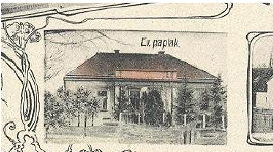
Iharosberényi evangélikus paplak régi képeslapon

A települést és környékét mélyen hithű, és áldozatkész polgárok lakták. Erre utal,