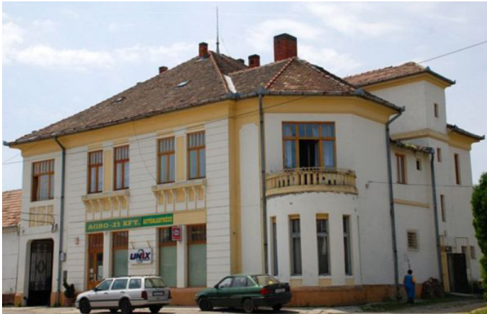
Rákóczi utca 110.

Vannak épületek, melyek elnevezésének eredetét néha már nem is tudjuk, de nevük szájról szájra terjedve öröklődik. Ilyen az egykori Óváros központjában elhelyezkedő bolt és lakóház épületegyüttese, mely időtálló esztétikáját és látványát megőrizve máig is a környék legemblematisabb épülete maradt.