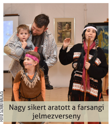
Nagy sikert aratott a farsangi jelmezőverseny

zül sem érkezett meg mindenki. Szerencsére azonban jöttek