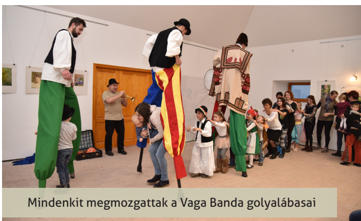
Mindenkit megmozgattak a Vaga Banda golyálabasai

Jelmezőversennyel kezdődött az idei farsangi mulatság a Történelmi Parkban. A február 3-án megtartott rendezvényen a szervezők vidám és sokszínű programokkal készültek kicsik-