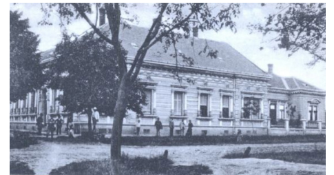
A mellékelt régi képeslapon, a könyvtár épülete mellett jól látszik a ház és a kerítés az eredeti állapotában. A ház főbejárata az utca felől, a mai egyik ablak helyén volt. A rendelő az oldalsó szárny végében, külön bejárattal kapott helyet. A járda vonalában téglabástyás, kovácsoltvas mezős kerítés határolta az épületet.