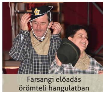
Farsangi előadás örömteli hangulatban

mint ezáltal a rendezvényeinken is egyre több résztvevőt köszönhetünk. Ez olyannyira