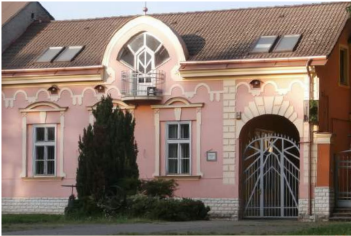
Petőfi tér 34.