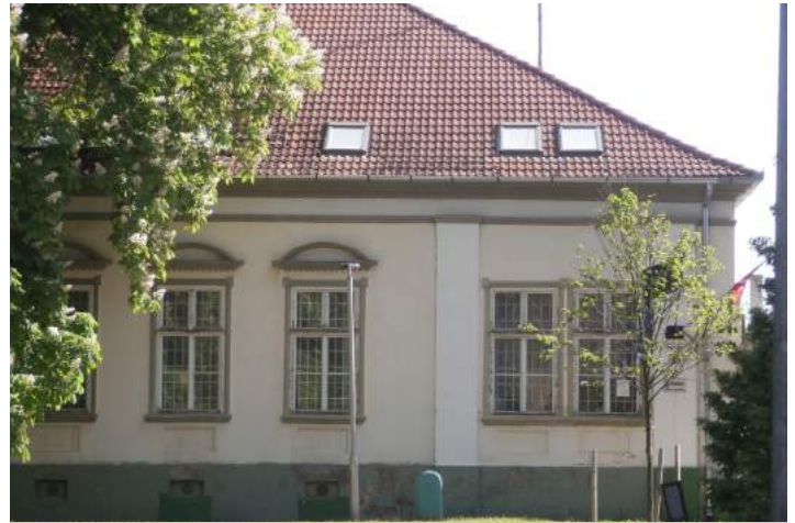
Petőfi tér 36.

A Hochreiter család évszázadok óta tagja volt a magyarországi nemességnek, azon belül 1828 óta újbóli megerősítést kapott a kihirdetett törzsökös és nemesi somogyi családok sorában. Főbb birtokaik Porrog és Somogybükkösd környékén helyezkedtek el.