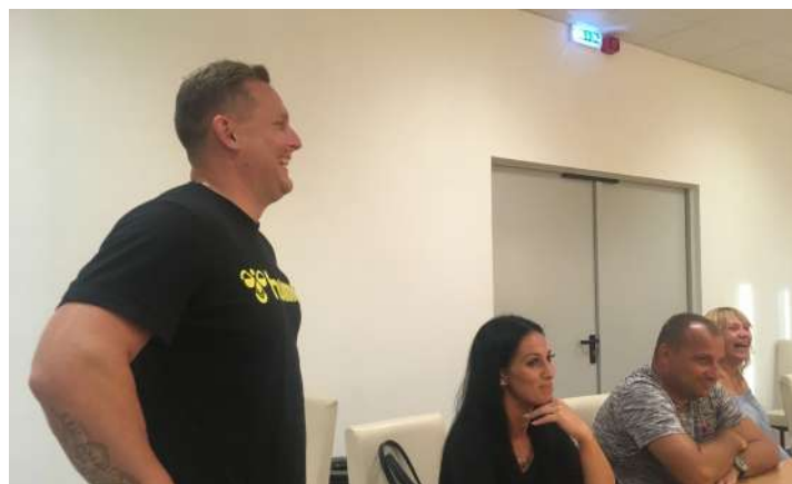
cél: megnyerni az NBII-es bajnokságot

Vasárnap este (2018.08.05. - a szerk.) megtartotta bajnokság eleji szezonnyitó értekezletét a Csurgói Női Kézilabda Club, ahol részt vettek felnőtt csapatunk tagjai, bemutatásra kerültek a megújult szakmai stáb tagjai valamint elnökségünk tagjai kijelölték az éves bajnoki célt illetve technikai információkról kaptak játékosaink tájékoztatást.