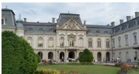
A keszthelyi kastély egyik manzárdtetős, középső részlete

Az eredeti tervrajzok szerint a csurgói kastélynak is téglalapon, téglaboltajtásos pincéje volt, míg Keszthelyen a téglamellék mellett homokkő lapokat is használtak az alapzat elkészítéséhez. Legnagyobb ha-