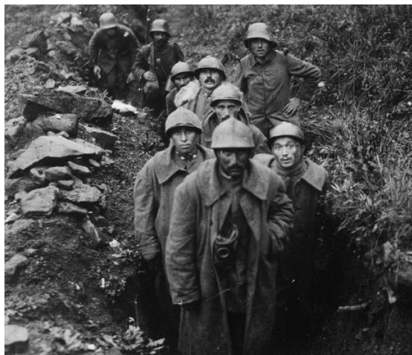
A központ hatalmak által elfogott és őrzött olasz hadifoglyok

Az I. világháború, vagy Nagy Háború, 1914-1918 centenáriumi éveiben fajdalommal telt hangokon emlékezünk a hatalmas vér és emberáldozatokat követelő csatákra, sok szenvedést kiállt magyar hadifoglyainkra, elhunyt katonáinkra, az itthon maradt özvegyekre, árvákra.