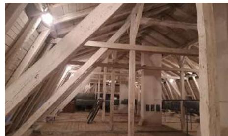
A keszthelyi kastély több száz éves tető gerendázata

mutatkozik. A csurgói kastély lecsapott végű nyeregtetőjének közepén, mintegy középső korona kapott helyet a manzárdtetős lakótorony, melynek közepét a Festeticsek címerének fél lábón álló daruja