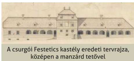
A csurgói Festetics kastély eredeti tervrajza, középen a manzárd tetővel