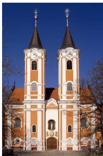
A Mária Gyűdi Keztytemplom