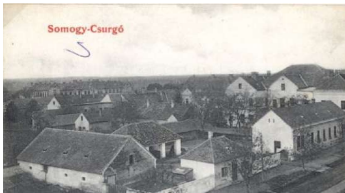
A Korona hátulról, jobbra az 1902-ben épült szállórészszel. Az udvarban istálló és nyitott pajta a lovak és kocsik számára. (Ma ez a terület a Petőfi tér 1. és 1/a.)