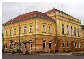
A Korona a 2000-es évek elején

presszó is működött a falai között. Sok csurgói emlékében elevenen élnek a teltházassal való élmények is. Az önkormányzat 1994-ben visszakapta, részlegesen értékesítette, majd részben vissza is vásárolta a tulajdonjogát. Korona egyes részeinek azóta is folyamatosak a tulajdonosi és bérlői változásai.