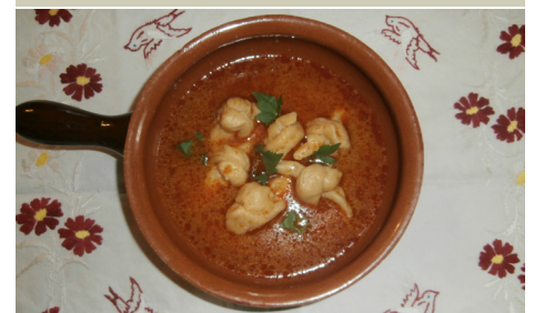
Alsoki "kötött gombóca leves" tálalása