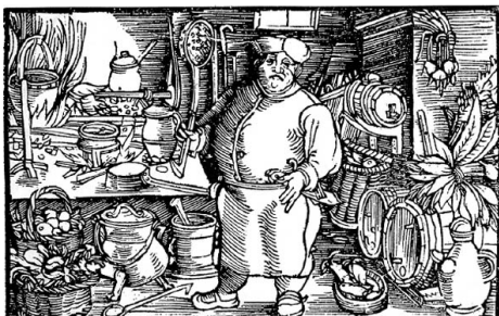
Középkori levesfőzés cserép fazekakban

Szinte a leves az egyetlen ételosztály, amelynek valamely típusa valamennyi népréteg minden napjában fő szerepet kapva az asztalra került. Bármennyire is gondoljuk, hogy a mai tradicionális, magyarnak tartott ételünk, mint a gulyásleves, krumplileves, paradicsomleves, rántott leves nagyon régiak lennének, ez nem így van. Első leveseink az ugynevezett „Húslék”, még csak vízben főtt hús (nagyon gyakran hal) fűszerekkel ízesített levéből álltak, melyeket később, még a rántás megjelenése előtt áztatott kenyérral sűrítették.