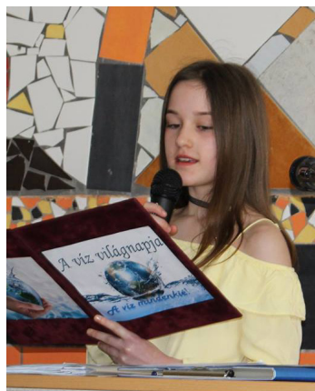
LITERA-TÚRA IRODALMI ÉS MŰVÉSZETI MAGAZIN