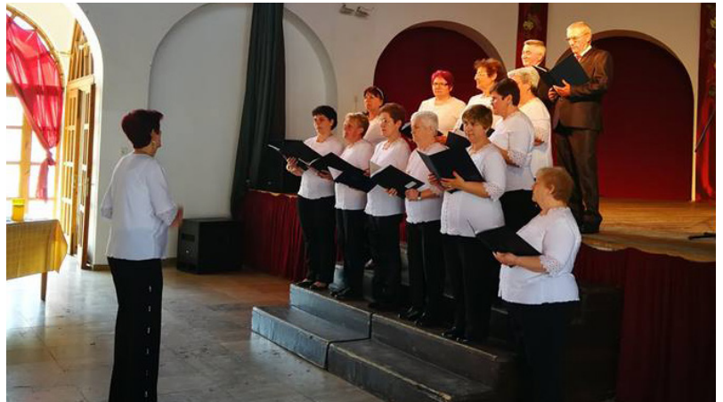
Az Iharosberényi Nosztalgia Egyesület énekara Örközd melódiákat adott elő