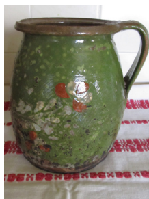
100 éves csurgói leveses fazék

A csombort, a tárkonyt, a hagymaféléket már ezer éve is használták eleink, de a finomabb, a levesek ízesítéséhez használatos fűszerek, mint a babérlevél, bors, pirospaprika csak a kereskedelmi úthálózatok kiépülésével kezdtek fokozatosan elterjedni.