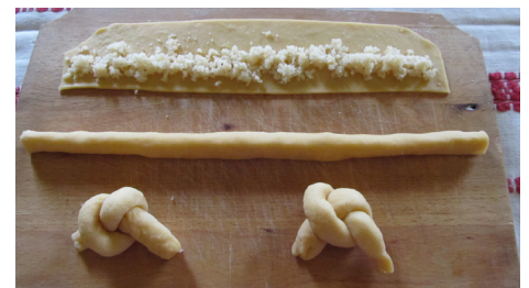
A kötött gombóc készítés folyamata

A mai Csurgó részét képező Alsók leveleinek egyik különleges, egyedi, de máig is létező fajtája a sima vagy „téföls” – tejfeles „kötött gombóca leves”. Melyhez tojással, vízzel egyszerű gyúrt tésztát készítettek. Vékonyra kinyújtották, majd