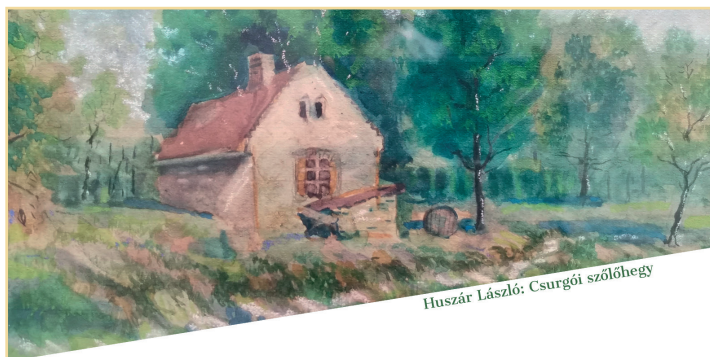
Huszár László: Csurgói szőlőhegy