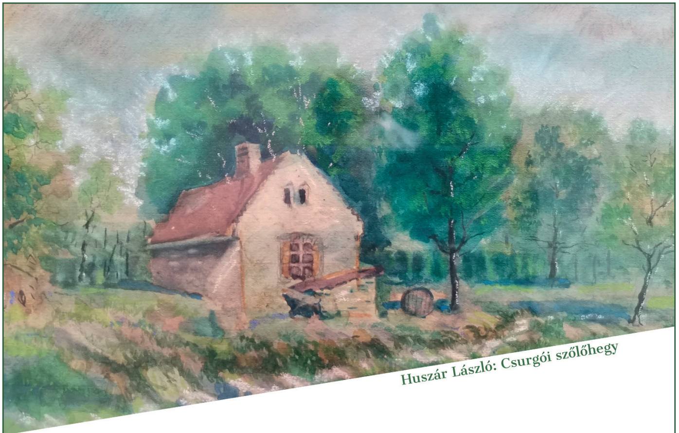
Huszár László: Csurgói szőlőhegy