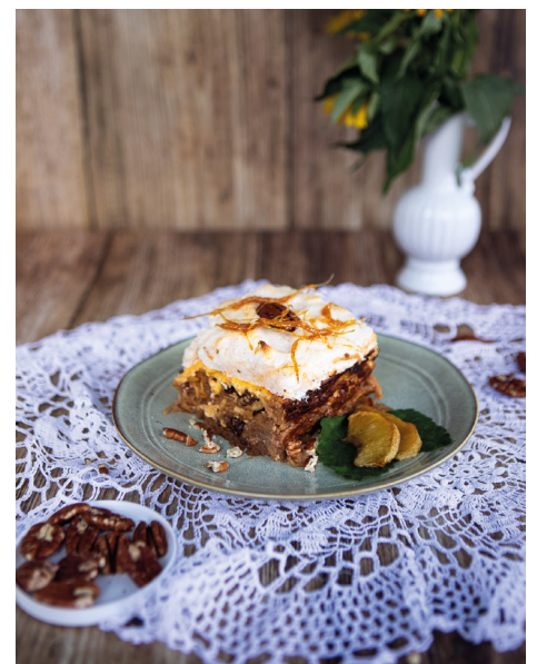
2024-ben Csusza mint főétel kategóriában a Kukorik és Korkodák (családsegítő) csapata nyerte