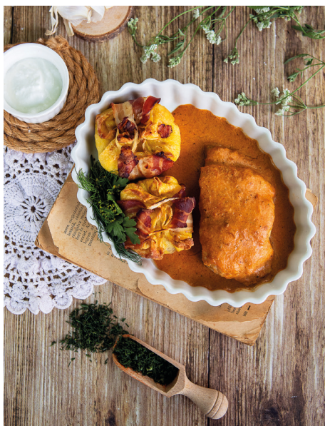
2024-ben Csusza mint köret kategóriában a Tértivevény (posta) csapata nyerte

Bízunk benne, hogy sikerült egy nagyon színes és színvonalas programkínálatot összeállítani, ami elnyerte a résztvevők tetszését, és minden korosztály megtalálta benne a számára élményt nyújtó lehetőséget.