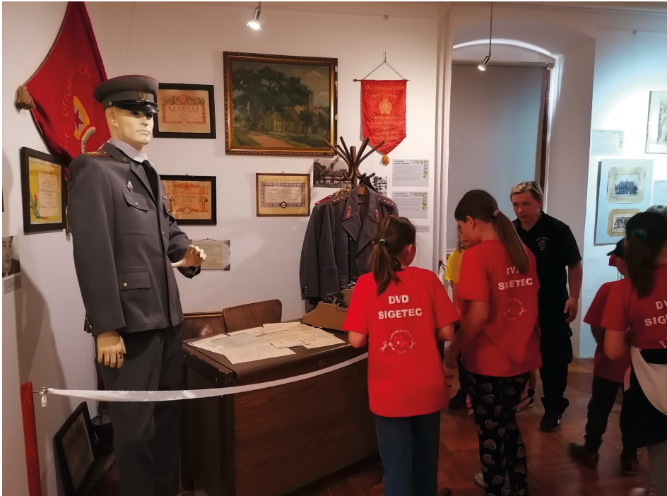
A DVD Sigetec ifjúsági tűzoltó csapata a tűzoltókiállításon

A Helytörténeti Gyűjtemény idén is már napokkal a Csuszafesztivál kezdete előtt elkezdett készülni a programra. A májusban már nagy sikert aratott Tűz(z) ki! c. szabadulóbódénk a tűzoltókiállításunkhoz