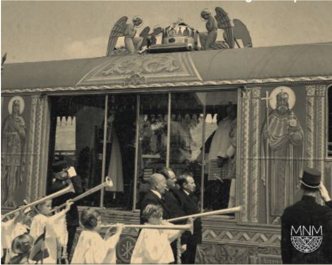
Az Aranyvonat a budapesti indulásakor

A Szent Jobb, egy olyan magyar nemzeti és katolikus ereklye, amely feltételezhetően Szent István magyar király természetes úton mumifikálódott jobb keze. Napjainkban vallástól függetlenül, minden magyar ember előtt a Szent Korona mellett a Szent Jobb a magyar államiság, az összetartozás, és a nemzeti tudat egyik legmeghatározóbb szimbóluma.