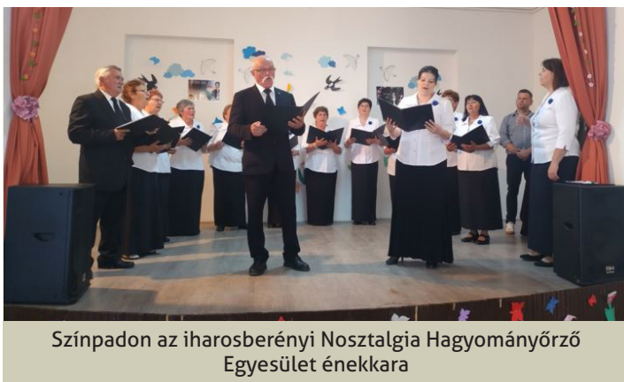
Színpadon az iharosberényi Nostalgia Hagyományörző Egyesület énekkara

Tavaszt idéző, színpompás viseletekbe öltözött fiatalos nyugdíjasoktól zsongott a rendezvényteremnek is helyet adó iharosi kiskastély, kultúrház színpada a Dráva-menti Nyugdíjas Klubok Köre által szervezett Tavaszi zsongás című kulturális