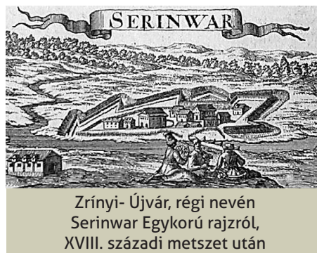
Zrínyi-Újvár, régi nevén Serinwar Egykorú rajzról, XVIII. századi metszet után

Zrínyi Miklós a török kiűzése és főként birtokai, a Mura és Dráva menti térség védelme érdekében egy védelmi vár építését kívánta megvalósítani, ezért, 1661-ben a bécsi udvarral szembemelve, a Mura völgyének egyik magas partján felépítette a von Wassenhoven németalföldi hadmérnök által tervezett Zrínyi-Újvárat.