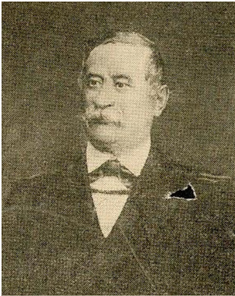
Soltra Alajos fényképe a Vasárnapi Újság 1899. 46. számában

Noszlopy Gáspárról és Soltra Alajosról utcát nevezett el Csurgón a hálás utókor, mégpedig egészen közel egymáshoz a Kertvárosban. A két egykori csurgói diák rászolgált az elismerésre; Noszlopyt Kossuth Lajos kormánybiztosként nevezte ki 1848-ban a Dráva-vidék védelmére, Soltra református lelkészként és orvosként lett Ráckeve környékének megbecsült embere, szeretett iskolája, a csurgói gimnázium számára tett nagy összegű alapítványa pedig sok szegény sorsú diák tanulását tette lehetővé.