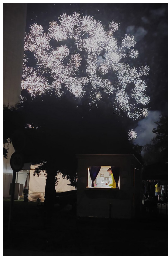
Szabadulókonyha a tűzijáték alatt

A játék lényege, hogy a játékosoknak megadott határidőn belül ki kell jutni egy szobából – innen az elnevezés is – a különféle logikai feladványok és rejtvények megoldása révén. Megjelenése óta egyre népszerűbb, mára a legtöbb nagyvárosban találunk helyszíneket, csak válogatnunk kell, milyen téma áll hozzánk közelebb. A