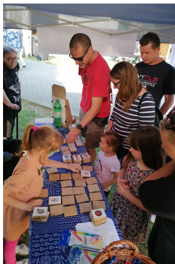
Lelkes memóriajátékosok a múzeumi sátorban