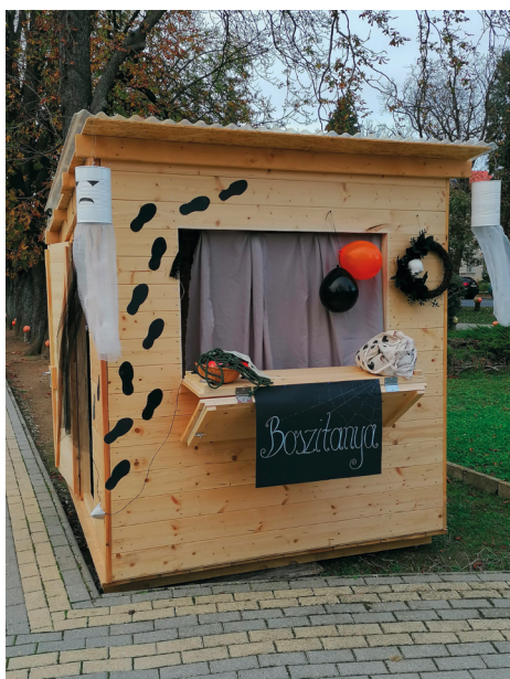
A boszityarás szabadulóbobé

A Csokonai Művelődési Ház idén októberben is megrendezte szokásos tökfaragós programját a főtéren. A tökfaragás mellett sütikóstolás, Csokit vagy csalok! játék és az általunk – vagyis a Helytörténeti Gyűjtemény munkatársai által – készített szabadulóbobé várta a gyerekeket. Utóbbi júniusban, a Csuszafesztiválon kezdte meg működését, a téma akkor mi más lett volna, mint a nagymama konyhájából való kiszar-