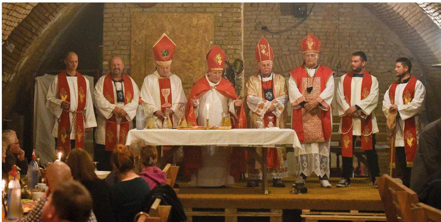
Borszentelés