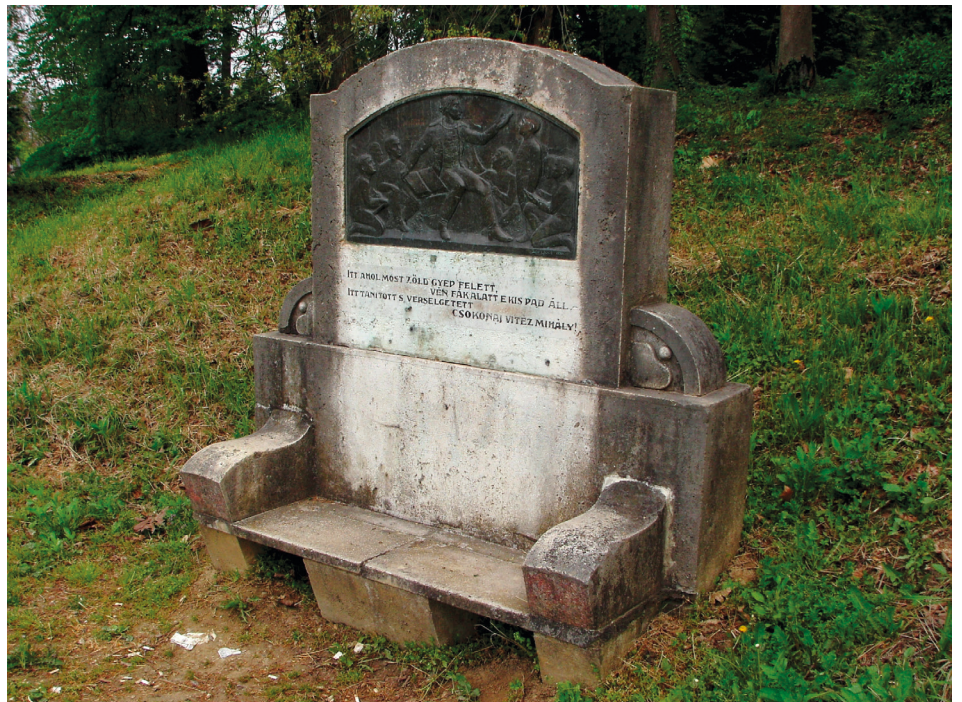
A Csokonai-pad