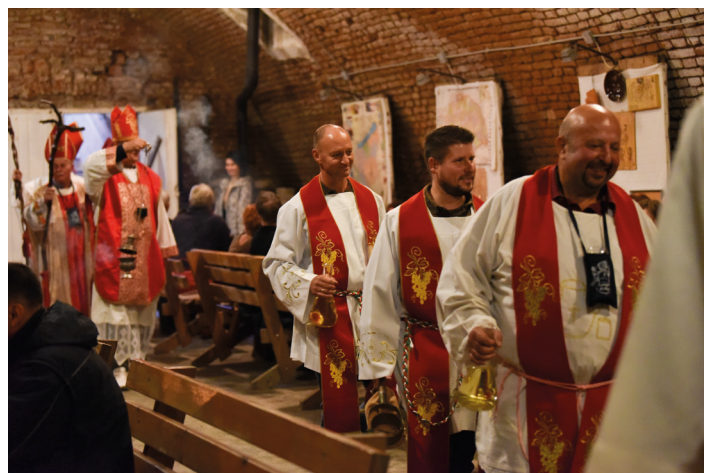
A borpüspökök és ministránsaik bevonulása