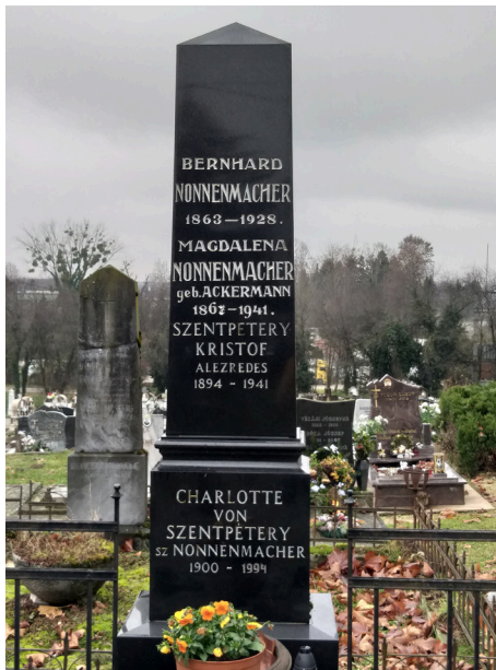
A Nonnenmacher család síremléke a József Attila utcai temetőben

A Tejgazdasági Szemle című szaklap 1935-ös tudósítása szerint a brüsszeli világkiállítás alkalmával megtartott nemzetközi világ-vajversenyen a Tejkiviteli Társaság, Csurgón nyerte a legmagasabb kitüntetést, a „diplome d' honneur”-t HANSEN-féle tiszta-kultúrával készített vajáért. 1936-ban 34 foglalkoztatott munkás-