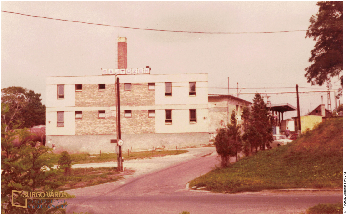
Az egykori tejüzem főépületei